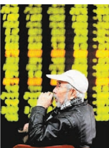
■內地股民稱，股票就該「捨得買，捨得賣」。

滬指昨日大幅跳水，是近5年來最大的單日跌幅。市場「恐高」情緒似乎更甚，部分股民紛紛拋售手中股票，但亦有股民熱情不減。