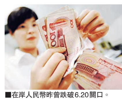
■在岸人民幣昨曾跌破6.20關口。

人民幣兌美元中間價昨日報6.1231，較周一上調51點，但即期匯率仍與中間價背道而馳。繼周一跌破6.16元關鍵技術位後，昨日看空人民幣情緒加速宣泄，盤中一度重挫逾300點，跌破6.20元整數關口，低見6.2064，與中間價差距達833點，波幅達到1.36%。午後，中資大行結匯令跌幅收窄，收盤跌128點。兩日內人民幣跌幅達353點。