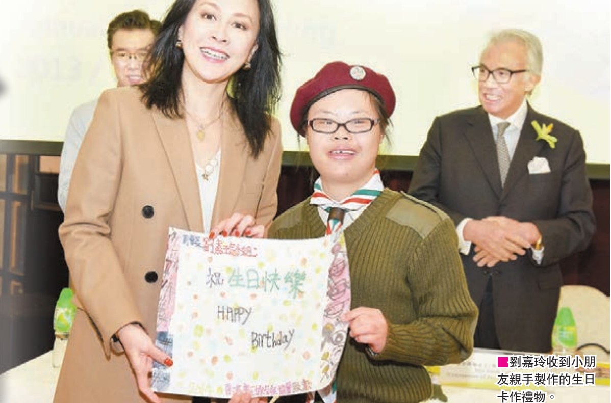
劉嘉玲收到小朋友親手製作的生日卡作禮物。