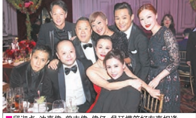
邱淑貞、沈嘉偉、曾志偉、偉仔、吳廷燁等好友喜相逢。