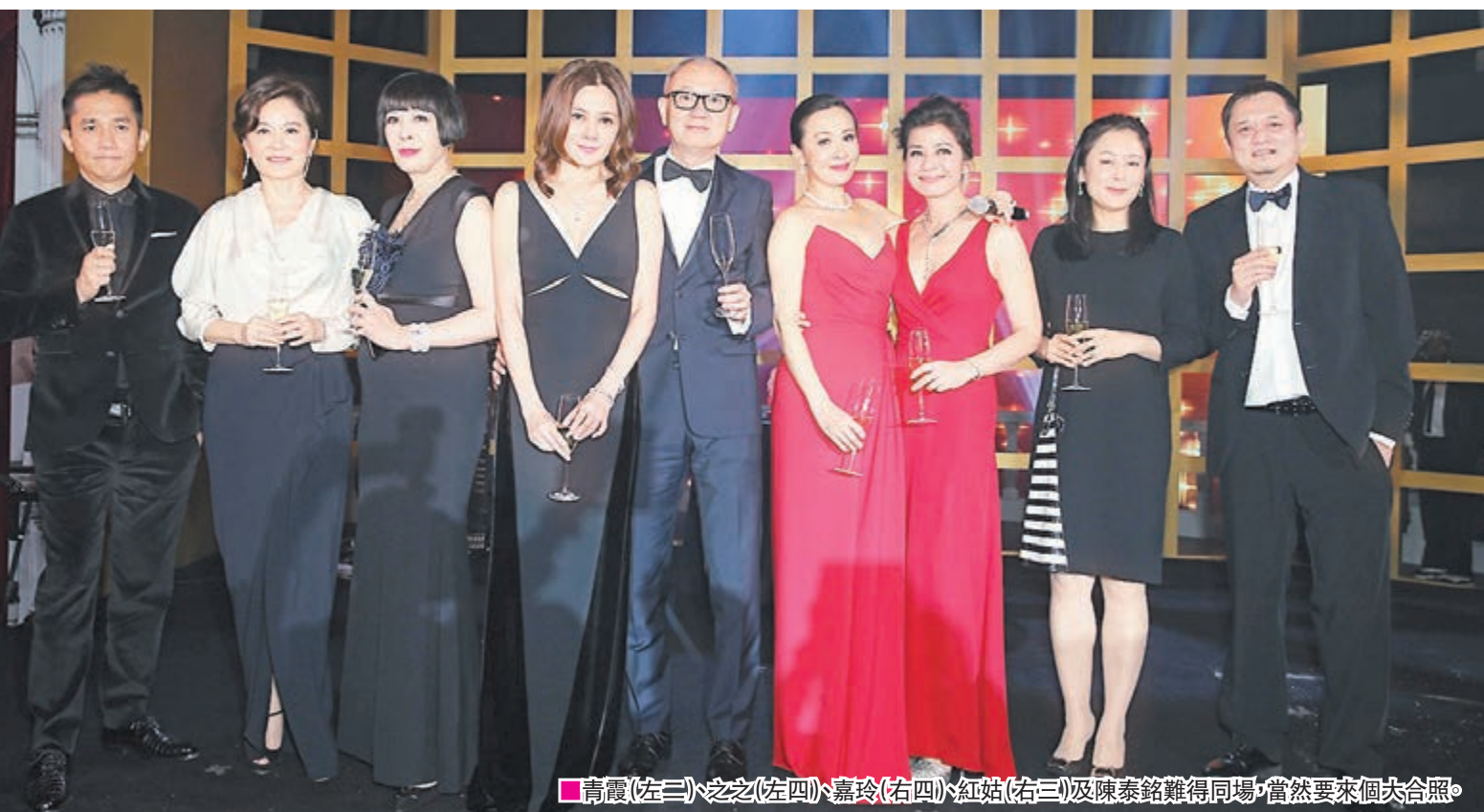
青霞(左三)、之之(左四)、嘉玲(右四)、紅姑(右三)及陳泰銘難得同場，當然要來個大合照。

香港文匯報訊（記者 李思穎）劉嘉玲昨日49歲生日，前晚在酒店舉行生日派對，場面熱鬧星光熠熠，不少賓客暢飲盡歡，飲到面紅腳浮浮，各人盡興而歸。例牌在聚會場合飲到不省人事的曾志偉，當晚醉到坐輪椅離開，而酒量極佳的壽星女嘉玲和老公梁朝偉則保持清醒享受這開心一夜，嘉玲不愧是圈中「千杯不醉」的女藝人。另外，嘉玲上周出席香港唐氏綜合症協會周年大會，喜獲由協會會員親手製作的生日卡作禮物，現場更齊唱生日歌為嘉玲預祝生辰，哄得伊人十分開心。