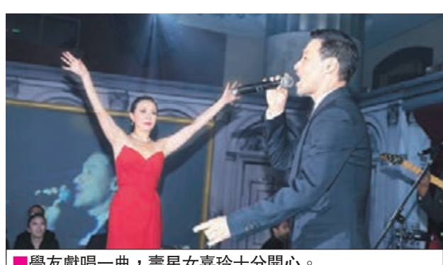
學友獻唱一曲，壽星女嘉玲十分開心。