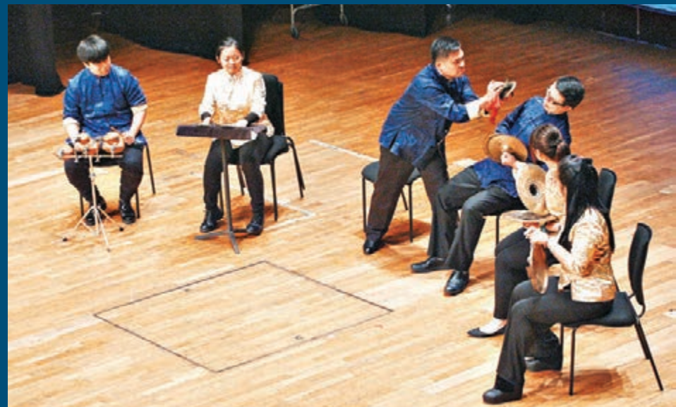
▶道樂團敲擊樂組以敲擊的形式表演《鴨子拌嘴》，活靈活現地勾畫了鴨子的神態。