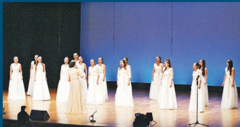
■深圳愛樂伊人室內合唱團為大家送上美妙的歌聲。