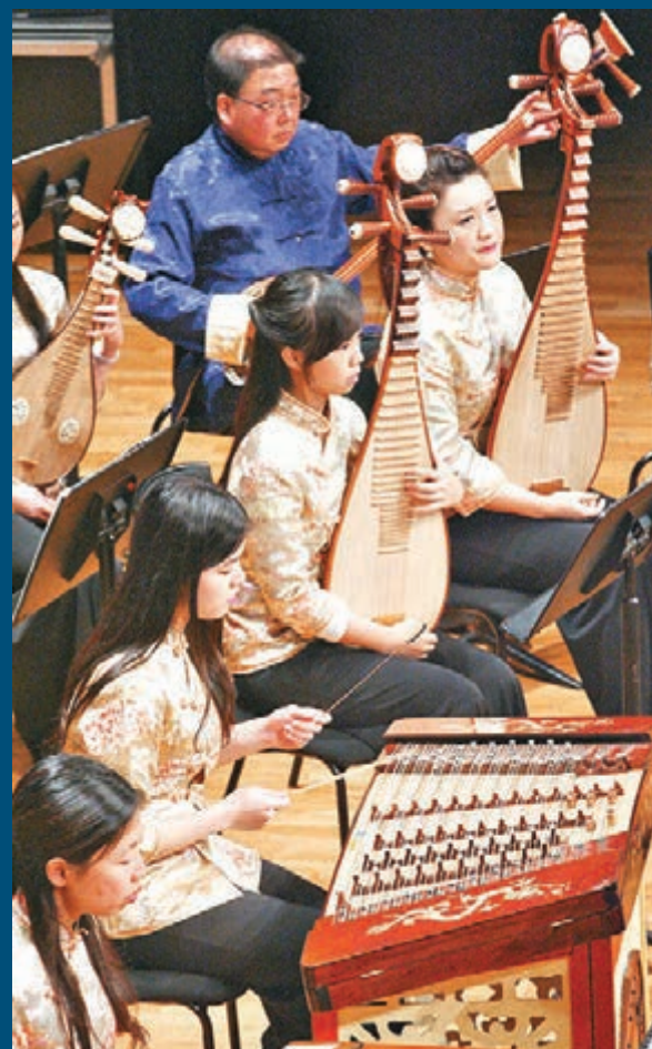
▲香港道樂團團員全情投入演奏。