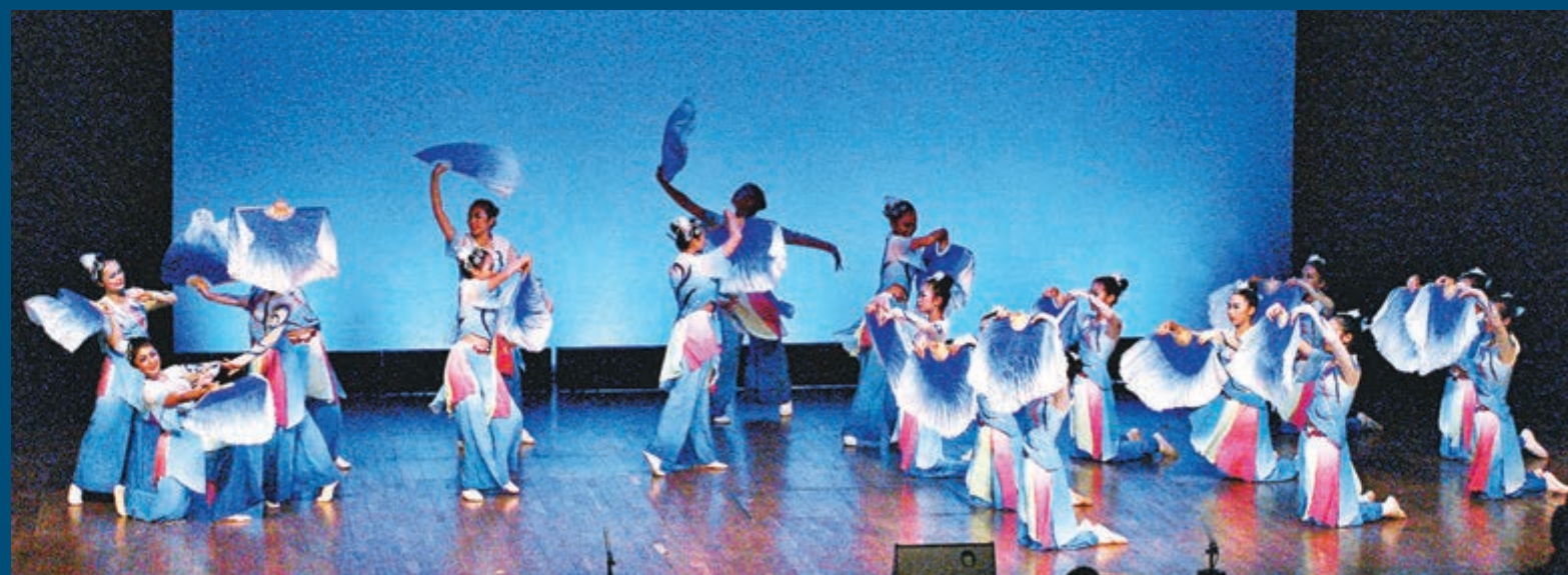
■香港道教聯合會鄧顯紀念中學舞蹈團，《扇花浪影》將浪花呈現在舞台上。