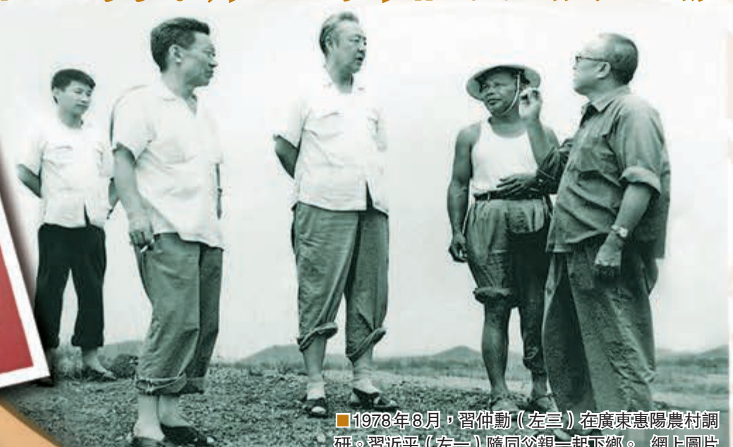
1978年8月,習仲勳(左三)在廣東惠陽農村調研。習近平(左一)隨同父親一起下鄉。