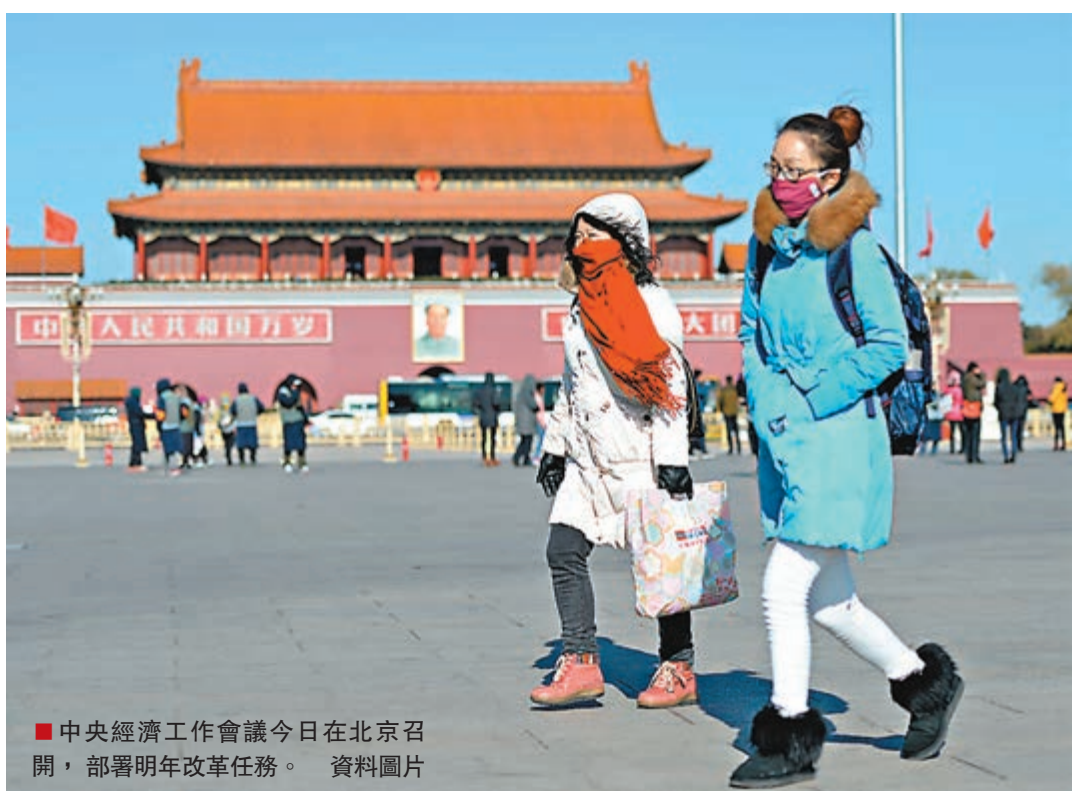
中央經濟工作會議今日在北京召開,部署明年改革任務。資料圖片

香港文匯報訊(記者 海巖 北京報道)據了解,一年一度的中央經濟工作會議於今日在北京召開,此次會議不僅是2015年經濟政策的「定調會」,還將是全面深化改革第二年的首場改革動員會。2015年被視為全面深化改革的「關鍵之年」,此次會議上,中央料會向各地方諸侯、各部委高官進行明年改革的總動員,國企、財稅、金融、社保、土地、司法等一系列改革方案有望明年落地實施。而為加快改革步伐,明年中央可能將治理的重拳打向「不作為」,以此強化行政推力、提高行政效率。