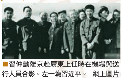
習仲勳離京赴廣東上任時在機場與送行人員合影。左一為習近平。

香港文匯報訊(記者 葛沖、張聰 北京報道)經過歷時三年多編寫,《習仲勳畫傳》日前由人民出版社出版,今日起正式上架發行。據了解,書中記載了習仲勳蒙冤16年、與家人長久別離以致分不出兩個兒子,以及習仲勳弟弟擬提副省級被習仲勳否定,特別是習仲勳大力推動廣東率先實行改革開放等諸多鮮為人知的細節,並刊登照片300餘張,包括數十張習仲勳在不同時期與夫人、兒女以及孫輩們的合影,其中還有多張習近平跟隨習仲勳下鄉調研的照片,為首次披露。