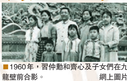
1960年,習仲勳和齊心及子女們在九龍壁前合影。