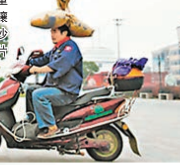
「頂狗哥」每天上班頭頂百斤重的沙袋，並讓「小黑」站在沙袋上。