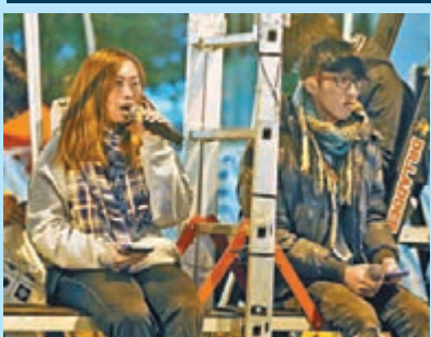
▲有「佔領」者在台上宣布絕食。