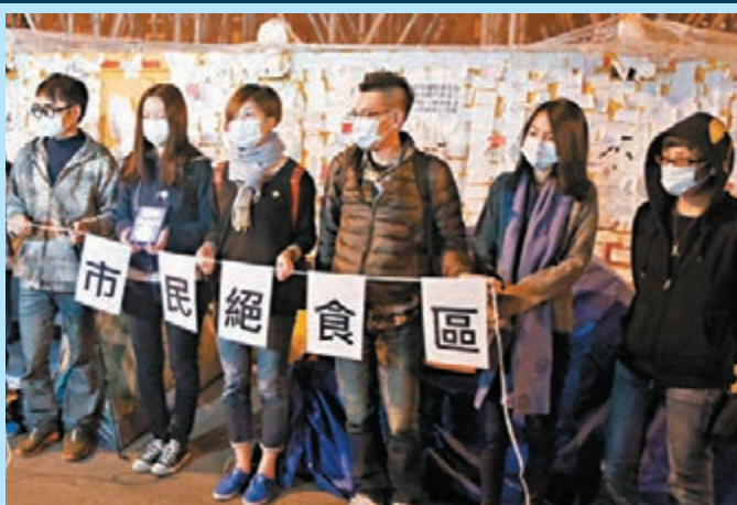
▶有「佔領」者在金鐘「佔領區」設立「市民絕食區」。