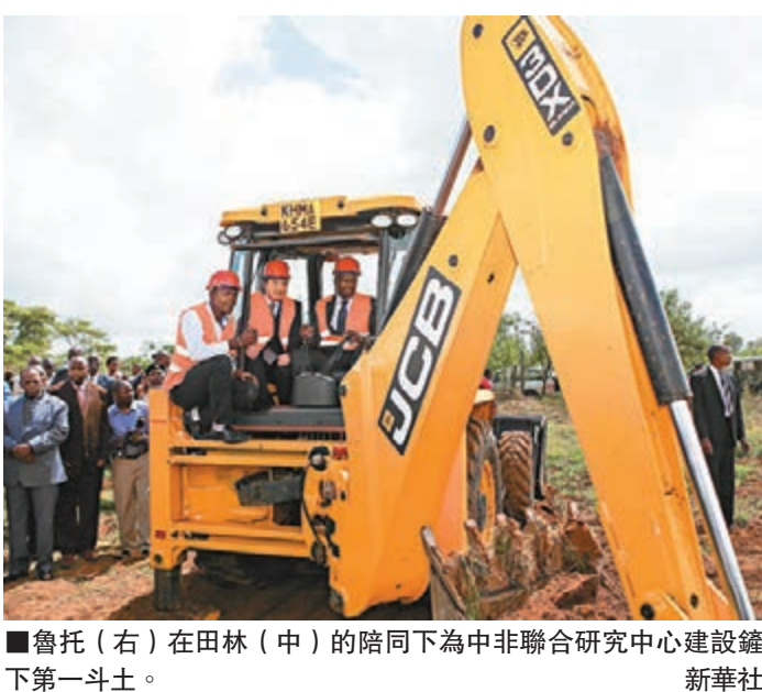
魯托（右）在田林（中）的陪同下為中非聯合研究中心建設鏟下第一斗土。

中非聯合研究中心去年已啟動31個合作研究項目。中心位於喬莫·肯雅塔農業與科技大學校園內，佔地面積約40畝，預計於2016年完工。