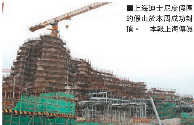
上海迪士尼度假區的假山於本週成功封頂。

中國與美國並無引渡協議，但仍可透過起訴涉案人違反移民法例將其遣返中國，若是同樣違反美國法律，亦可在美國法庭審理。