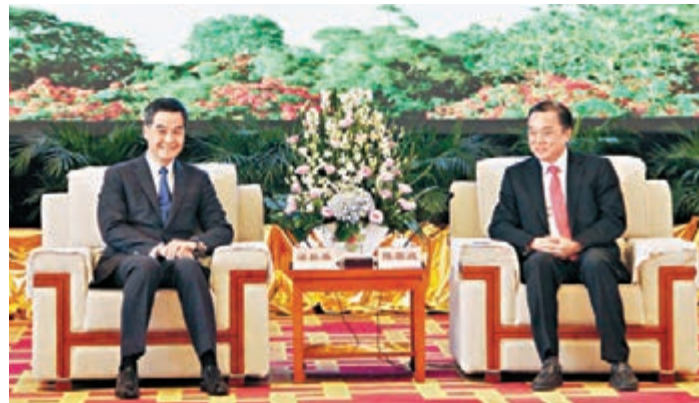
梁振英昨與惠州市委書記陳奕威會面。