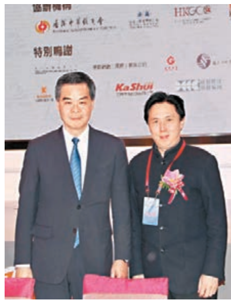
梁振英與歐陽曉晴合影。

研磨完後，茶道姑娘沖入開水適當攪拌，用撈子濾出茶渣，再加入炒米、花生米、米果、薄皮等。這樣，一杯集香、甜、苦、辣於一體的插茶便泡成了。梁振英愉快地品嚐插茶，其他主席團成員也都點頭稱讚插茶極具地方特色。主辦方以這種方式啓動當晚交流晚宴顯得別具一格。