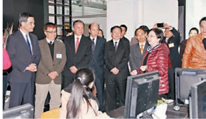
梁振英參觀惠州學院，與師生交流。