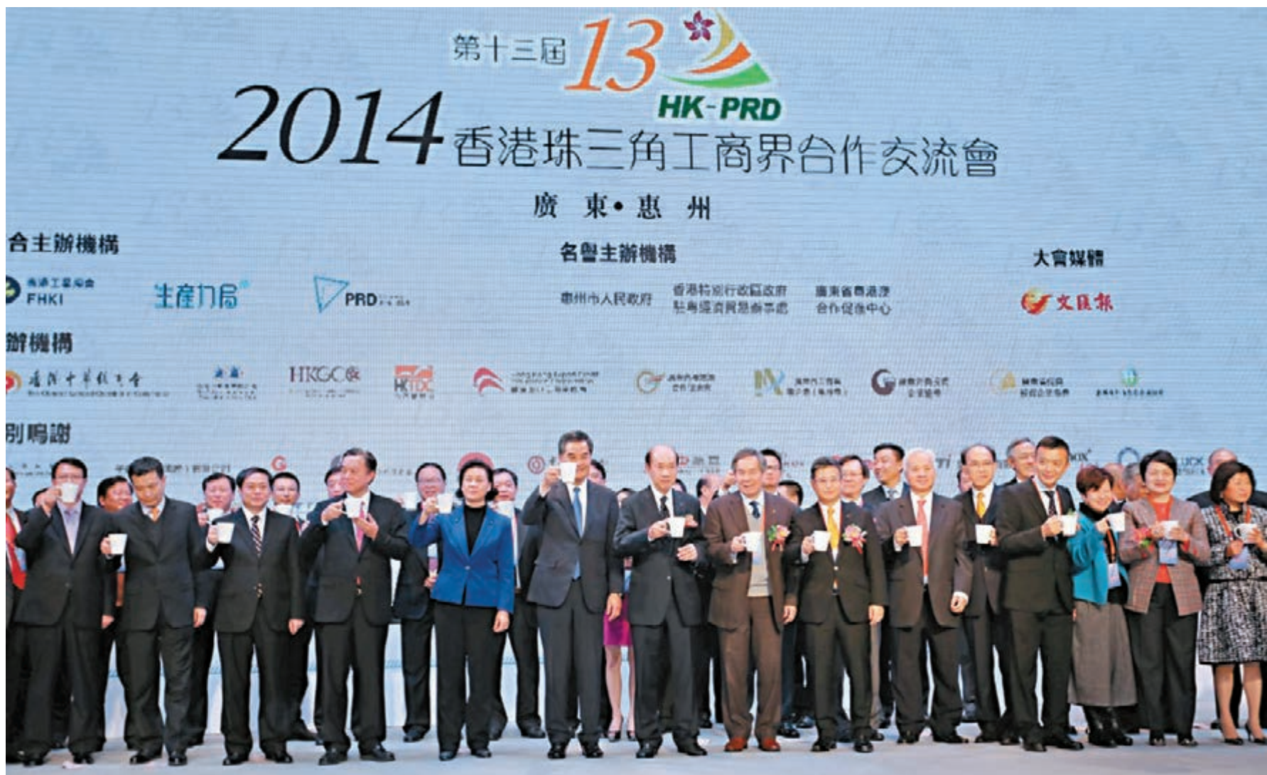
香港特首梁振英、廣東省副省長招玉芳、香港工業總會主席劉展灝及多位主禮嘉賓，昨齊品嘗插茶來啓動晚宴。