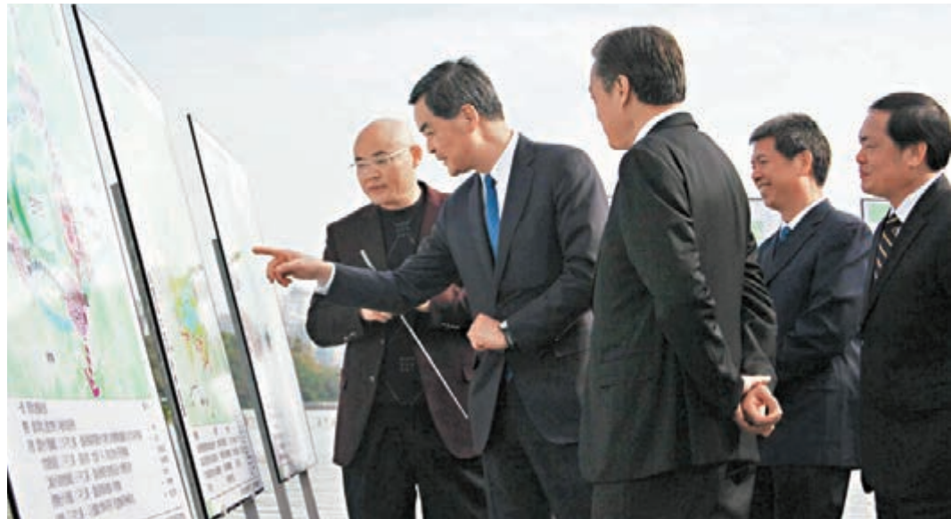
梁振英昨參觀豐渚園，了解潼湖生態智慧區的規劃。