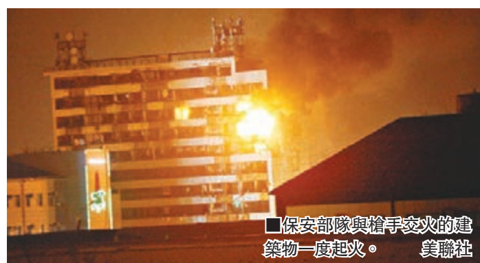
■保安部隊與槍手交火的建築物一度起火。

俄羅斯總統普京昨日發表國情咨文前夕，車臣首府格羅茲尼受到武裝分子襲擊並爆發槍戰，造成至少20人死亡，包括10名警察，另有至少28人受傷。俄羅斯國家反恐委員會指，槍手來自一個在北高加索地區活動的組織，並與已故車臣恐怖大亨烏馬羅夫有關。