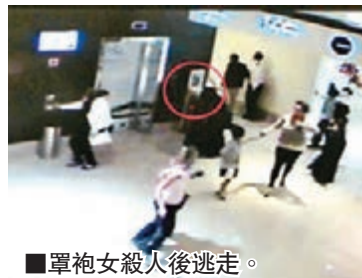
■罩袍女殺人後逃走。