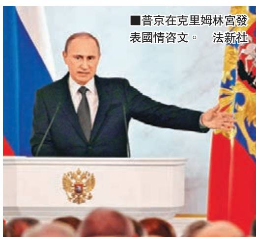
■普京在克里姆林宮發表國情咨文。

普京期望俄國經濟能不必仰外國鼻息，鼓勵國內企業投資本土，期望2018年本土投資佔國內生產總值(GDP)的25%，又要求促進本地工業