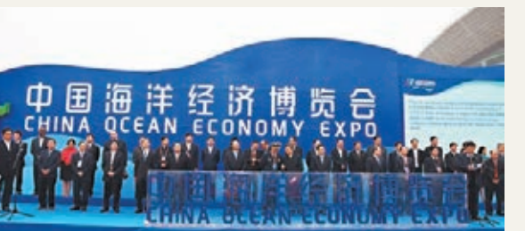
中國海洋經濟博覽會開幕。

瑞郎兌歐美元周二續跌觸及三周低點,投機客在瑞士黃金儲備公投之前建立的瑞郎多頭部位,持續遭到解除。歐美元兌瑞郎升至1.2048瑞郎,為11月7日以來最高。