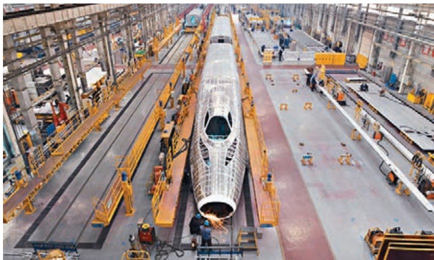
中國南車傳增發新股收購北車資產,中國北車則將退市。 資料圖片

該報引述接近國資委人士消息指,有關部門日前認同吸收合併方式,合併初稿已上報國務院。初步方案的思路是,由中國南車增發股份吸收合併中國北車全體股東所持的股份,並按照商定的換股比例轉換為中國南車的