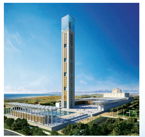
■世界第三大清真寺——阿爾及利亞大清真寺。