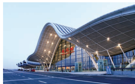
■世界首個「橋建合一」站房——武漢客運專線武漢站。

一條條高架長龍，一座座跨江彩虹，一次次攻堅克難。在建橋之都的大武漢，時代在呼喚爭先的中建三局人到萬里長江「中流擊水」，譜寫「天塹變通途」的壯美詩篇。