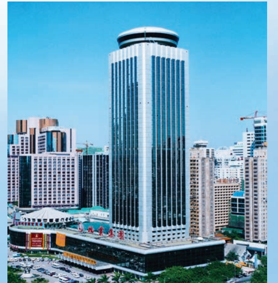
■中建三局承建的深圳國際貿易中心，以「三天施工一個結構層」的施工速度創造了「深圳速度」。