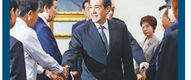
馬英九逐一與中常委握手致意，揮手道別。