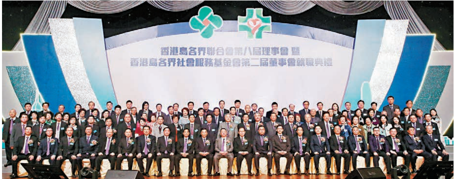
▶香港島各界聯合會第8屆理事會暨香港島各界社會服務基金會第二屆董事會就職典禮場面隆重。