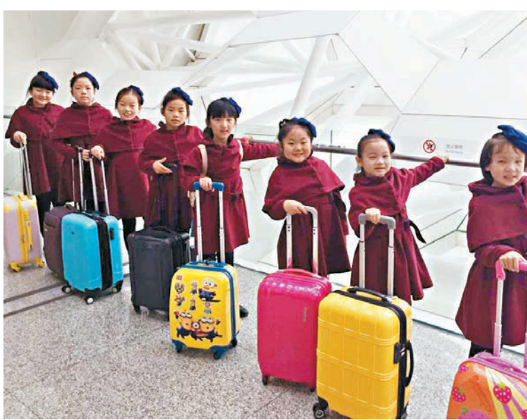
■8名來港演出的陽光小演員。