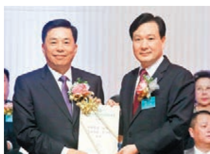
■林武頒發選任證書予郭二澈主席(左)。

香港文匯報訊(記者黃晨)香港島各界聯合會第八屆理事會暨香港島各界社會服務基金會第二屆董事會就職典禮,昨晚假灣仔會展中心新翼大會堂隆重舉行。全國人大代表蔡毅蟬聯第八屆理事長。梁安琪、郭二澈分別榮膺基金會會長及主席。特區區政行政官梁振英、中聯辦副主任林武、中聯辦港島工作部部長吳仰偉、立法會議員譚耀宗、民政事務總署副署長陳積志蒞臨主禮。政界、商界知名人士,300多個團體代表,賓主逾1,600人歡聚一堂,見證盛會,場面盛大,喜氣洋溢。