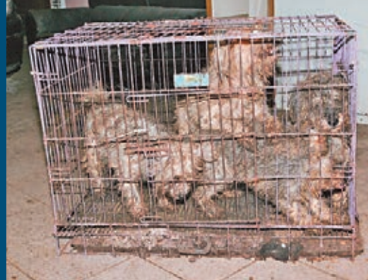
■多隻狗隻共處一籠。