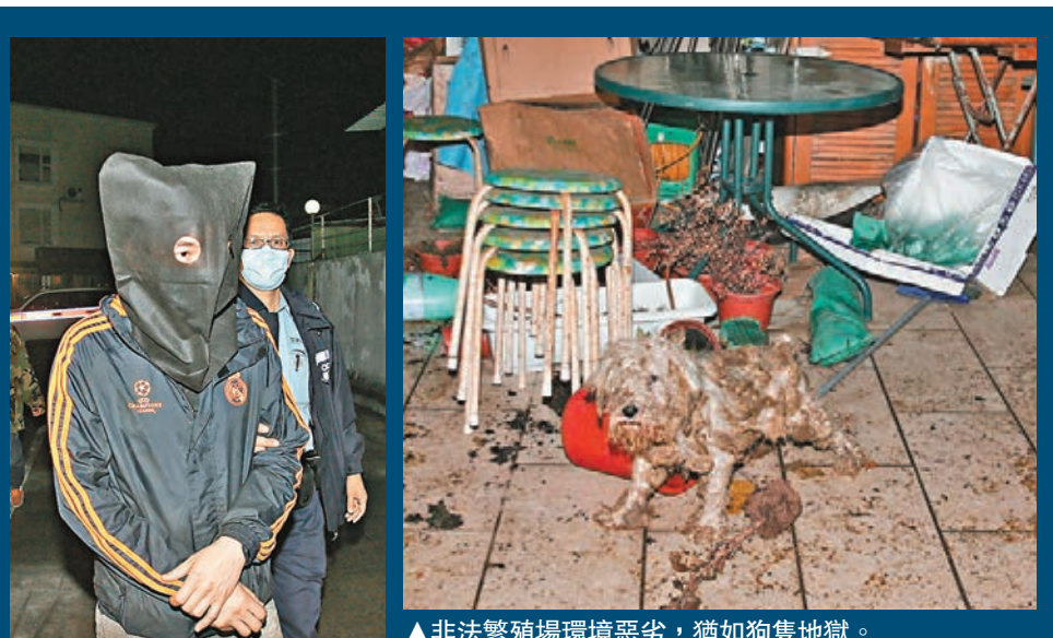
▲非法繁殖場環境惡劣，猶如狗隻地獄。

是次疑遭虐待的35隻狗，包括摩天使及金毛尋回犬等，其中7隻已由漁護署接管，其餘則由會方照料，初步證實部分狗隻已植入晶片。愛護動物協會發言人指，部分摩天使大獲救時滿身污漬如同「地拖」，更傳出刺鼻惡臭，另有金毛尋回犬的腹及臀部沾滿糞便，慘不忍睹。不少狗隻因長期缺乏照料及被困環境惡劣地方，致患有不同程度皮膚病，實際健康狀況有待檢驗。