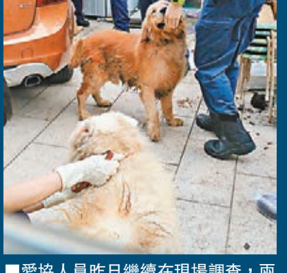
■愛協人員昨日繼續在現場調查，兩隻金毛尋回犬仍滿身糞便。