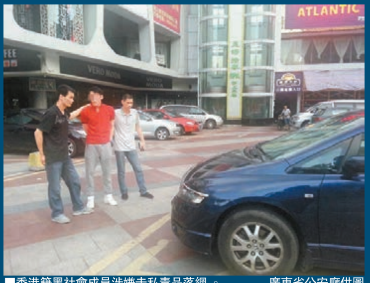
香港籍黑社會成員涉嫌走私毒品落網。