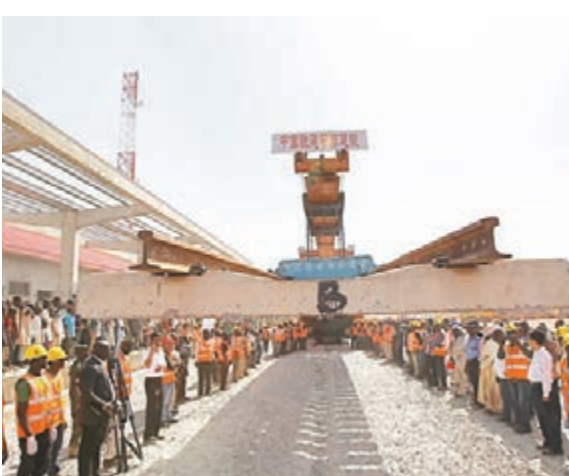
首條中國標準鐵路1日在尼日利亞全線貫通。

中國鐵建董事長孟鳳朝表示,阿卡項目全線鋪通,為2015年正式通車運營奠定了基礎,樹立起了中國鐵路及中國鐵路標準走出去的信心,也提振了尼日利亞乃至西共體大力發展鐵路的決心。