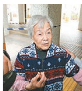
余婆婆慶幸有熱心鄰居拍門通知走火警。

富怡樓火警現場充斥煤氣味，並傳出爆炸聲，大批居民惟恐重演10日前石硤尾邨大爆炸慘劇，紛紛執拾「逃生三寶」落樓逃生，有街坊更透露起火單位重傷的男屋主手臂有紋身，不知是否有不良嗜好，平日常有陌生人出入其單位。