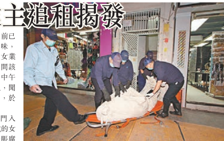
大南街服藥再燒炭齊死的兩名女子遺體昇送殮房。

警員及消防員接報到場破門入屋，揭發兩名分別30歲及35歲的女子齊倒斃床上，屍體已開始發脹腐爛，傳出陣陣惡臭，床邊遺有炭灰及服剩藥物，警員初步相信兩人為朋友關係，懷疑雙雙服藥後燒炭齊自殺，估計死去約一周。