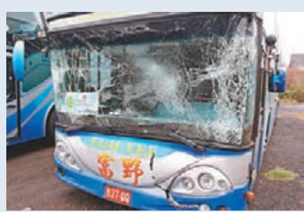
港團遊覽車追撞。

香港文匯報訊 (記者 杜法祖) 一個由本港一間公司組織的80多人旅行團，昨晨分乘3輛旅遊巴士在台灣阿里山公路行駛時，其中兩輛巴士發生追撞意外，共釀11名團員受傷，猶幸各人均傷勢輕微，意外原因有待調查。