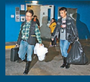
釀成火警的單位不斷冒出濃煙。