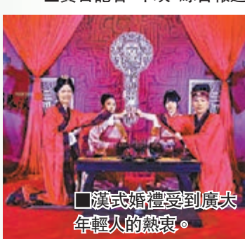
漢式婚禮受到廣大年輕人的熱愛。