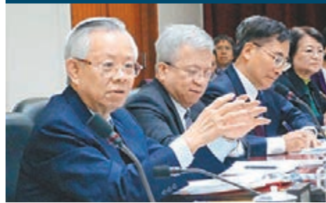
彭淮南(左一)獲藍委連署推薦。資料圖片

有守，行事不卑不亢並具決斷力及魄力，身為11A總裁(全球金融雜誌A級評價)，備受民眾肯定，享崇高國際聲望，是極難得人才。民進黨「立法院」黨團總召集人柯建銘也認同彭淮南任「行政院長」。彭淮南1998年接任台「中央銀行」總裁，迄今已做到第4任。近年每逢「行政院長」傳出異動，彭淮南幾乎都是被點名接任的人選之一，但他一再重申，現在的工作是自己公務員最後一個工作。