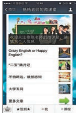
「艷艷老師的微課堂」微信服務號更具交互性與即時性。

談起這種新模式，同學們認為課上活躍，課外輕鬆。「課上翻書本，課外刷手機，英語學習，輕鬆搞定。」有學生認為，微課堂最大的吸引力在於它的匿名性，「許多在課堂上不敢提問的問題，在這裡我都