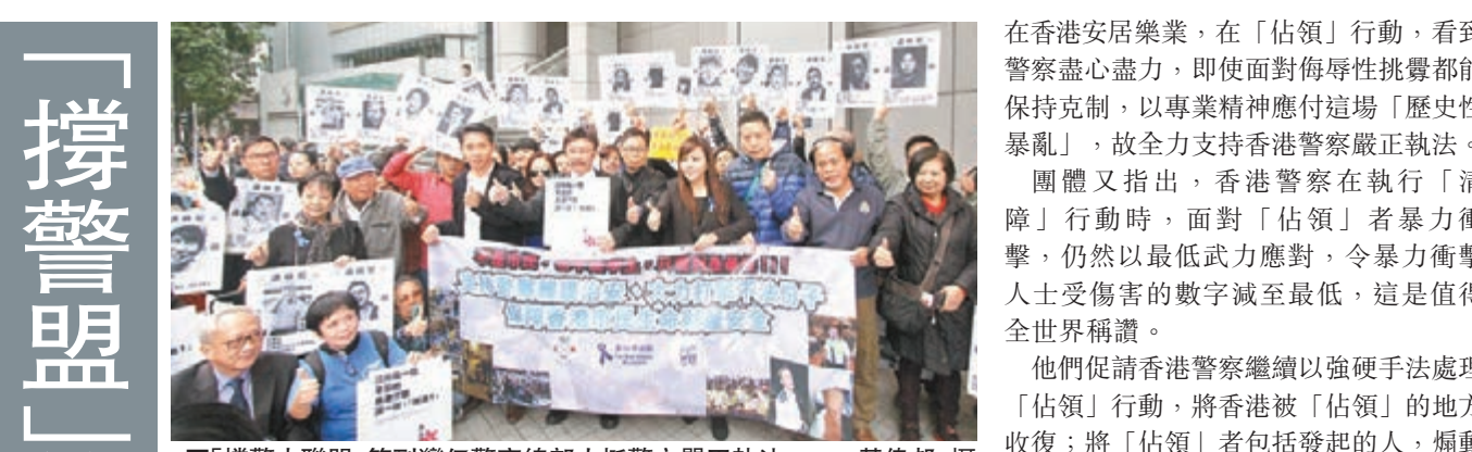
■「撐警大聯盟」等到灣仔警察總部力挺警方嚴正執法。

警方昨日表示，相信不少到金鐘的參與者是曾非法「佔領」旺角街道的人，當中有激進分子與團體發號施令，煽動在場者使用暴力，向警方不斷推進、衝擊，並蓄意破壞公物。對於有人在網上號召以自製臭彈擲向警員，