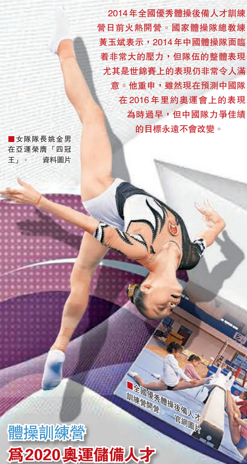
■女隊隊長姚金男在亞運榮膺「四冠王」。資料圖片

體操訓練營 為2020奧運儲備人才 2014年全國優秀體操後備人才訓練營30日在安徽體育運動職業技術學院體操館火熱開營。此次訓練營旨在選拔備戰2020年奧運會後備人才，進一步提高全國體操教練員專業教學水平。 據悉，今年的訓練營時間為11月29日至12月10日，參加訓練營的分別是來自全國各地1998年至2002年出生的男子優秀運動員和2000年至2004年出生的女子優秀運動員以及他們的教練。訓練營不僅給孩子們安排了豐富多彩的訓練課，其間黃玉斌等國家隊金牌教練還將現場指導各隊的訓練工作，同時為地方隊教練員授課。 「我們舉辦這個訓練營，是為了加強我國優秀體操後備人才培養，儲備2020年奧運會優秀人才，進一步提高全國體操教練員的專業教練水平。」黃玉斌說，「我希望通過本次訓練營，引導全國體操後備人才的技術發展方向，教練員發現並及時糾正在技術訓練中存在的問題，破除陳舊的訓練方法、手段、理念和模式，與時俱進，緊跟國際體操技術發展潮流，在技術上與國家隊的要求接軌。」