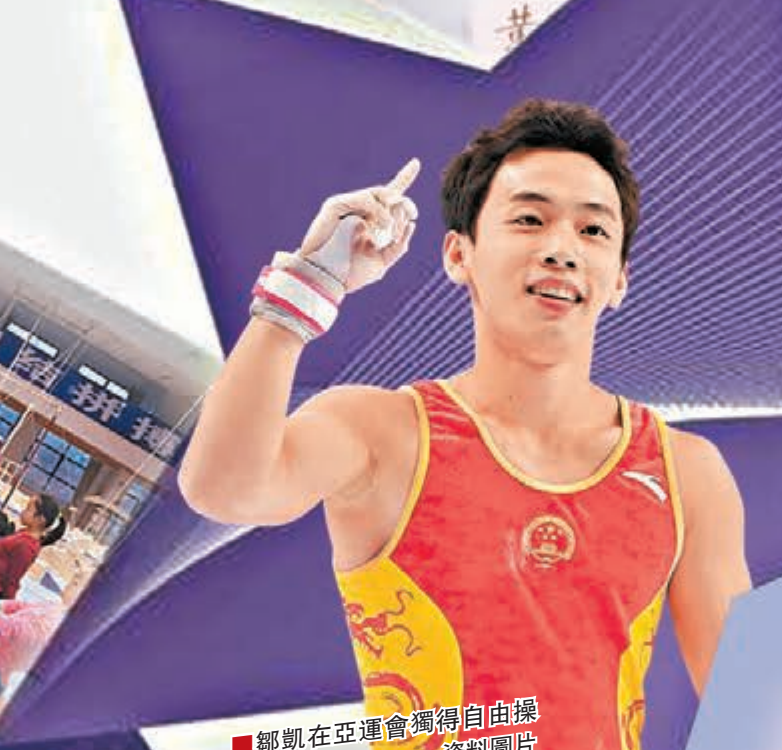
■鄒艷在亞運會獨得自由操和單槓兩金。資料圖片