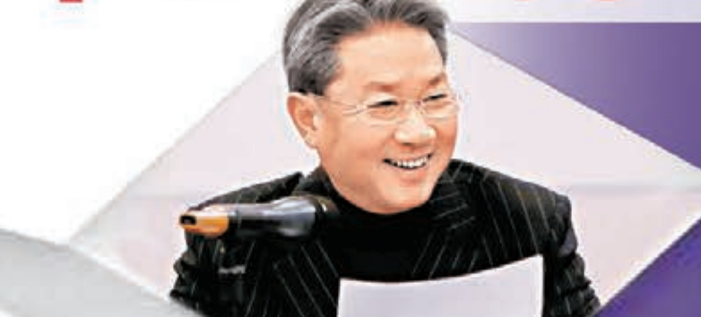
■國家體操隊總教練黃玉斌。資料圖片