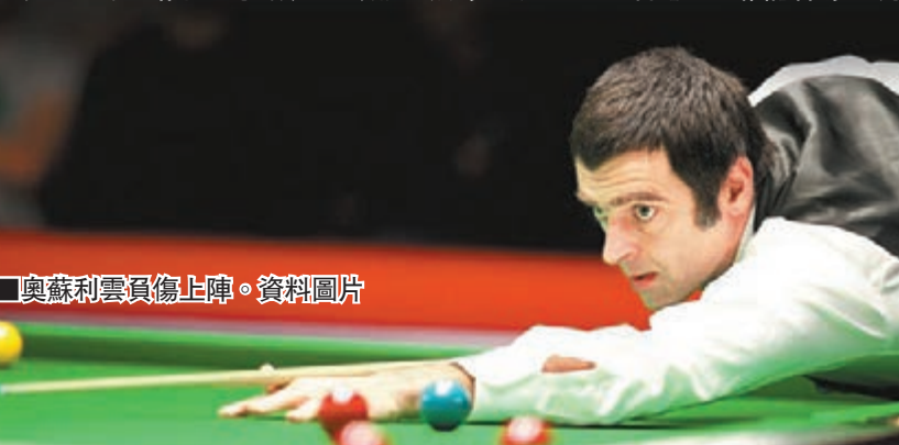
■奧蘇利雲負傷上陣。資料圖片