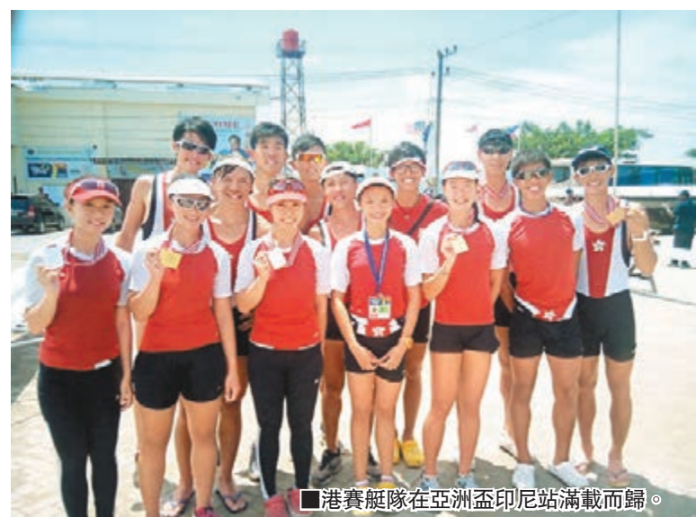
■港賽艇隊在亞洲盃印尼站滿載而歸。