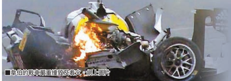
■韋伯的戰車嚴重撞毀及着火。