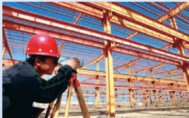
■蘭州新區的建設工地上，測繪人員一絲不苟地工作。

2012年12月，蘭州新區獲批成為西北地區首個國家級新區不足百日，即推出「引進的國家級有突出貢獻的中青年專家、國家重點學科、重點實驗室、工程研究中心主要專家、國家「千人計劃」入選人選，政府將給予100萬元安家費」的政策，額度創當時國內新高。