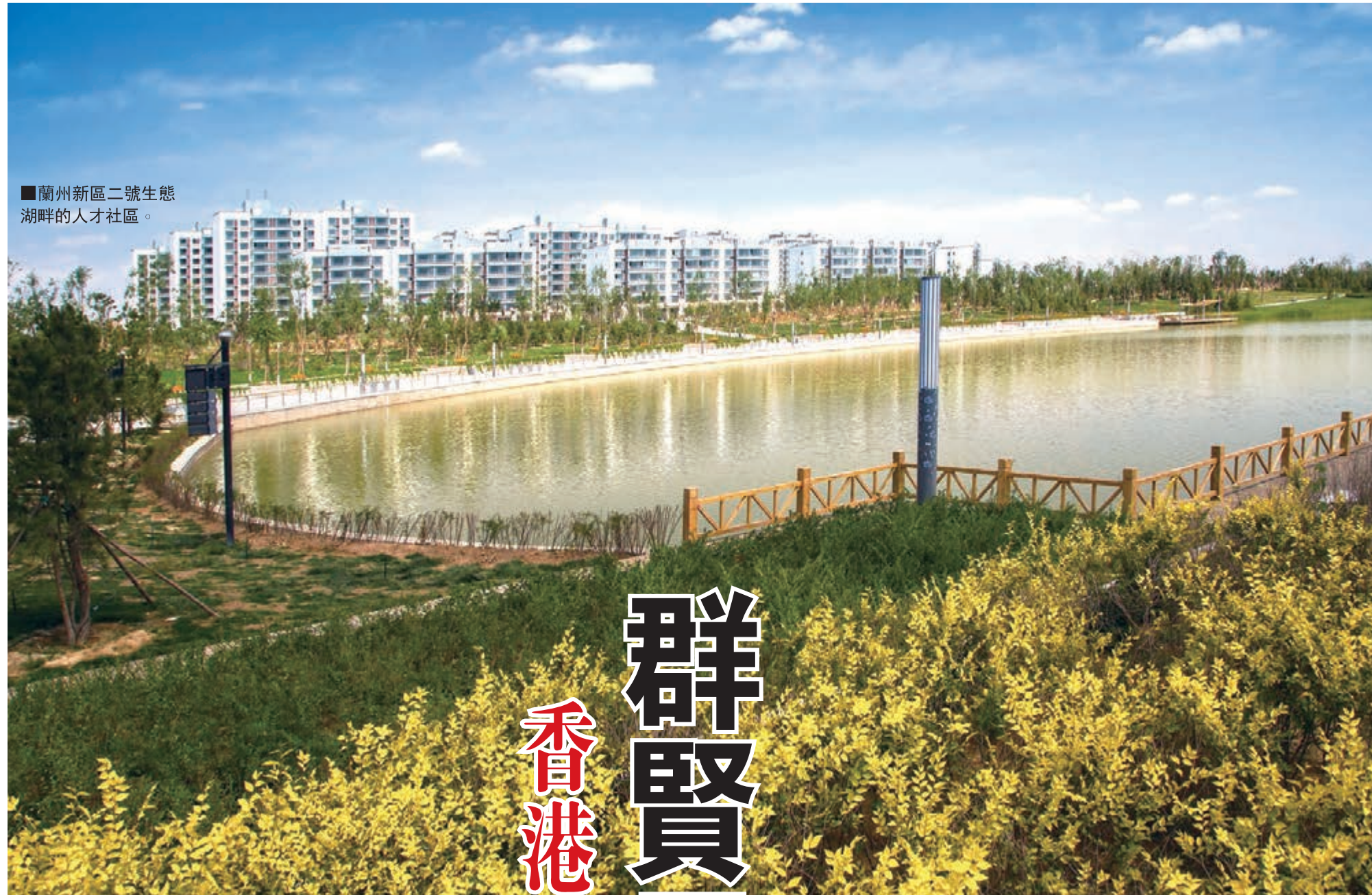
■蘭州新區二號生態湖畔的人才社區。