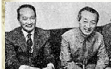
■吳清源(右)與哥哥吳夢略合影於1980年。