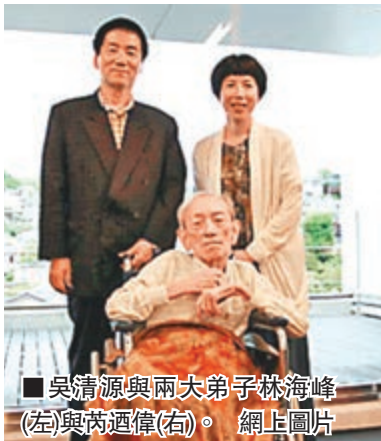
■吳清源與兩大弟子林海峰(左)與芮迺偉(右)。