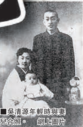
■吳清源年輕時與妻兒合照。