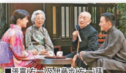
■張震(右一)及伊藤步(左一)拜見吳清源夫婦。