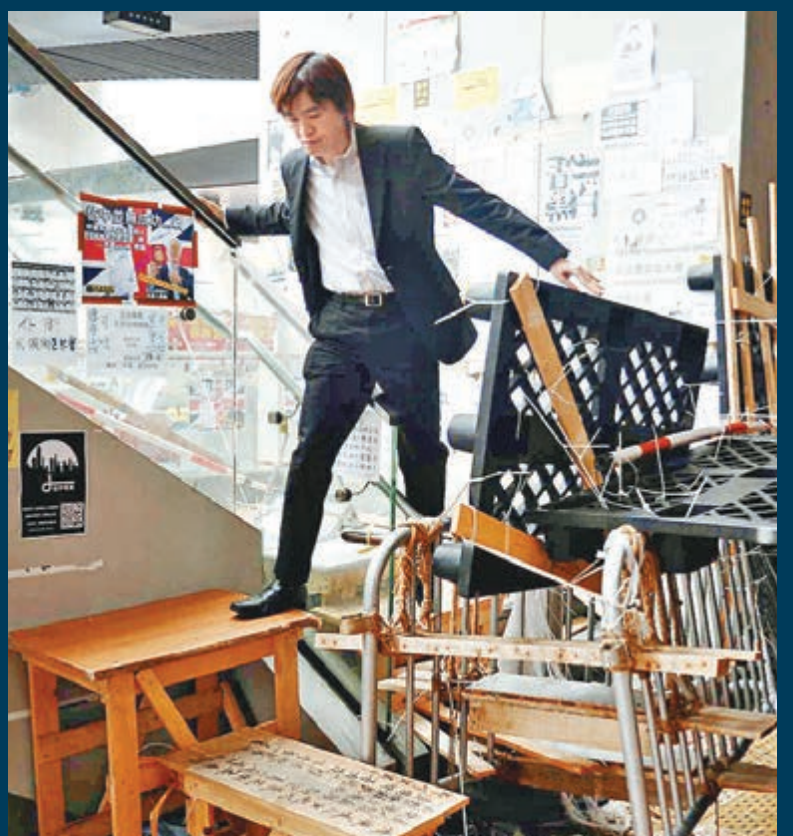
通往政總的入口被示威者堵塞，政總人員上班要從旁邊入口進入，並要跨越重重路障。