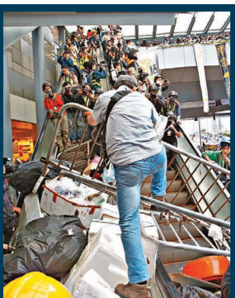
示威者一度圍堵政總，阻塞通道，令絕大部分公務員昨早未能返回政總上班。

對於被指「邀請」「雙學」進入立法會大樓的長毛，昨日承認其助理曾帶領「雙學」負責人進入立法會大樓，但否認「佔中指揮部」位於立法會內，認為有關說法是「子虛烏有」。他更無視民意擔憂顛倒事實，反指「指揮部」就在特首梁振英的辦公室內，稱「這班(「雙學」)是我的貴賓，今次帶(入立法會大樓)，下次亦都會帶。」