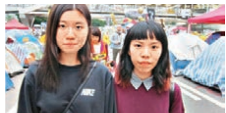
▲金鐘「佔領」者張同學(右)批評「雙學」計劃欠缺周詳，將進一步損失支持者的信心。

陳同學認為，示威者不應這麼激進，應以較和平的方式進行抗爭。他指，周永康、黃之鋒等人作為學生領袖，應該要走出來，站在最前線支持，認為他們「龜縮」的行為，會減少了市民對他們的支持。他並認為，現時整個「佔領」行動已經變質。