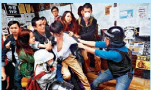
▲廠商會昨發表聲明譴責示威者暴力。圖為昨早通往政總入口天橋的衝突場面。

廠商會重申，「佔領」行動由9月28日啟動至今，已經維持了兩個多月，嚴重影響各行各