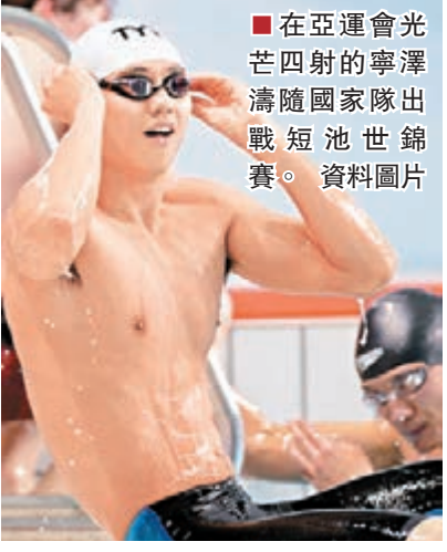
在亞運會光芒四射的寧澤濤隨國家隊出戰短池世錦賽。資料圖片

中國游泳隊昨日凌晨從北京飛赴卡塔爾多哈，參加12月3日在那裡開幕的短池游泳世錦賽。受禁藥風波影響的孫楊正在昆明冬訓，今次沒有赴賽；在亞運會上勇奪四金的寧澤濤成為出征隊伍中最耀眼的明星，在首都機場，不時有粉絲要求合影。中國游泳隊領隊許琦在接受《法制晚報》訪問時介紹，原本中國游泳隊計劃派出40人參加本次短池世錦賽，但由於部分隊員仍在辦理簽證，昨晨只有34名隊員出發。「我們這次比賽主要是鍛煉隊伍，這個比賽是國際泳聯的一個高規格