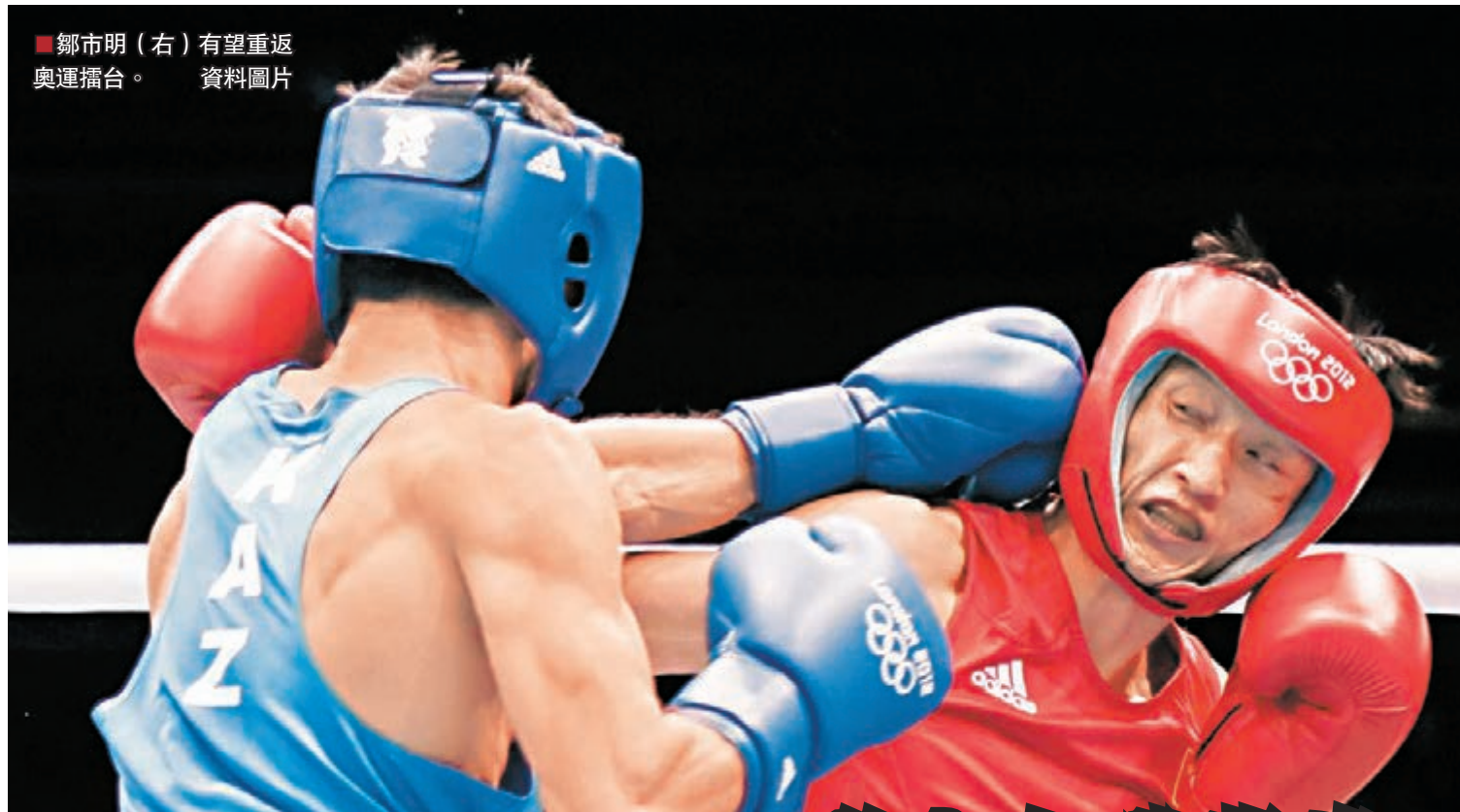
鄒市明(右)有望重返奧運舞台。