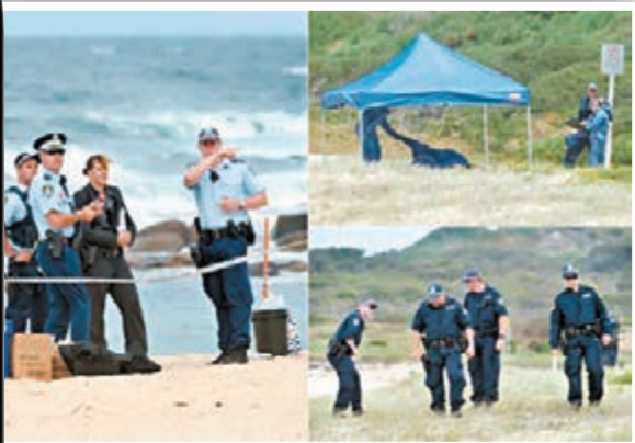
警方封鎖海灘，在現場搜證。

澳洲悉尼一周前發現有初生嬰兒遺棄棄坑渠後，昨日又發現嬰屍。兩名男童上午在東部馬魯布拉一個沙灘玩耍時，意外被地面沙堆絆到，挖掘後發現一具埋在沙中的嬰屍，警方正調查嬰兒死因。