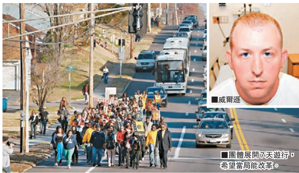
團體展開7天遊行，希望當局能改革。

美國密蘇里州弗格森鎮黑人青年布朗被槍殺事件餘波未了，雖然大陪審團決定不起訴開槍的白人警員威爾遜，但民眾怒火未有平息，更向威爾遜所屬警署發出死亡恐嚇。事發後一直受行政休假的威爾遜，前日通過律師宣布基於安全考慮，決定辭職。