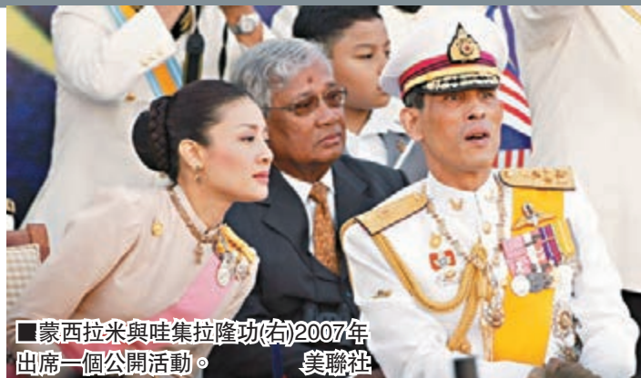
蒙西拉米與哇集拉隆功(右)2007年出席一個公開活動。 美聯社

調查的時機非常敏感。蒙西拉米是哇集拉隆功第3任妻子，兩人2001年結婚時，蒙西拉米家族獲御賜王室姓氏，兩人育有一名現年9歲的兒子，將是未來王位繼承人。雖然兩人近年仍會一同出席公開場合，但早已傳夫婦不和，故外界普遍認為今次事件顯示，兩人最終很可能離婚。 ■美聯社/英國廣播公司