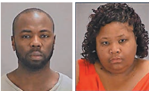
案中父親瓊因與其女友戴維斯。

錮、虐兒及妨礙公職人員罪，不准保釋，亦可能會被加控其他罪名。休斯透露，由於警察沒有發現男童失蹤的存檔，相信其母親可能由於不了解執法部門運作，因此只向兒童組織報告，沒有直接報警，導致警員未能及時協助。