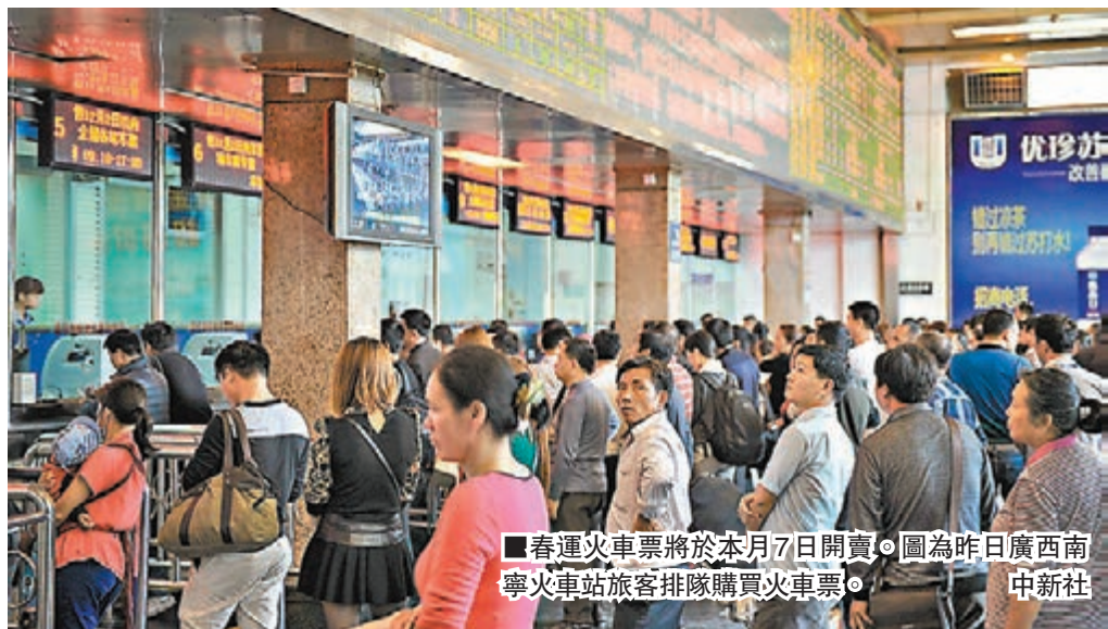
春運火車票將於本月7日開賣。圖為昨日廣西南寧火車站旅客排隊購買火車票。