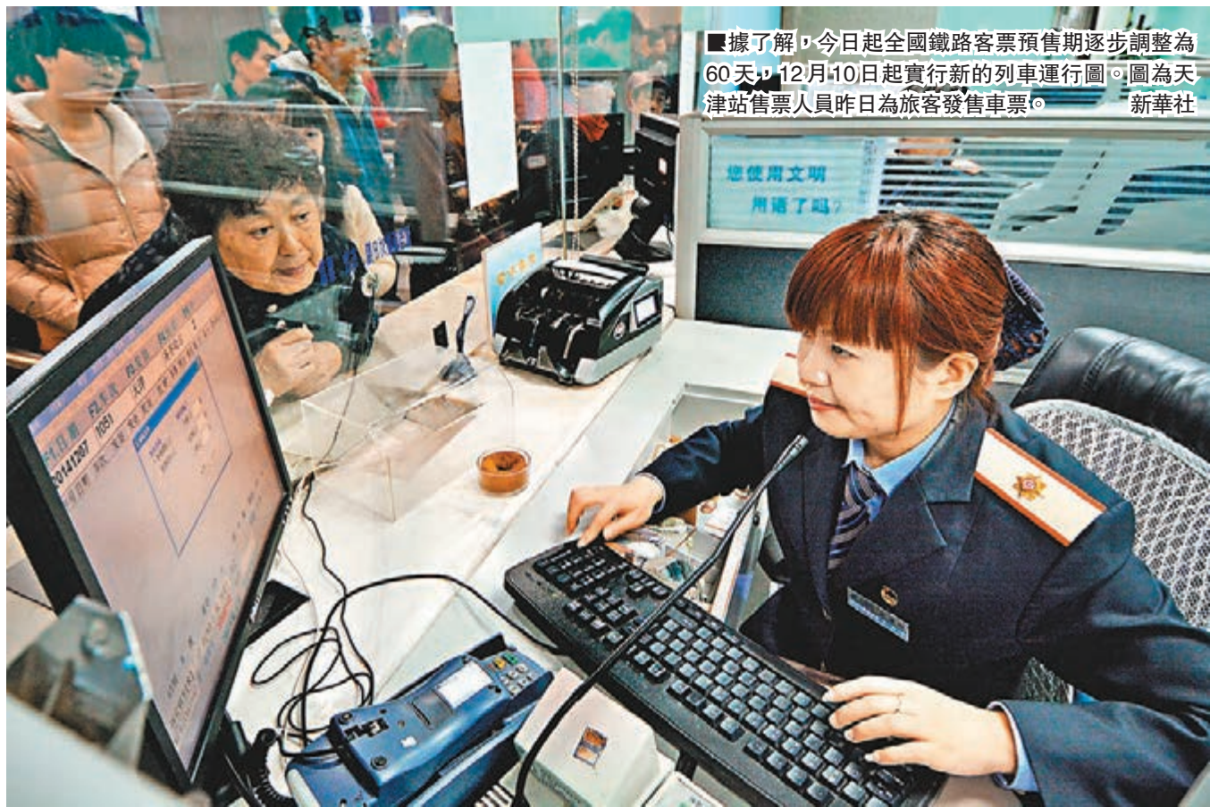
據了解，今日起全國鐵路客票預售期逐步調整為60天，12月10日起實行新的列車運行圖。圖為天津站售票人員昨日為旅客發售車票。

但是春運期間，這一方式有所變化，在執行按照原階梯退票辦法的同時，推行改簽後的車票乘車日期在春運期間的，退票時收取20%的退票費。也就是說，如果旅客購買了一張明年2月12日的車票，但是有事未能成行，改簽成2月15日的車票，如果再無法成行，即便在開車前4天退掉改簽車票，仍需支付20%的退票費。