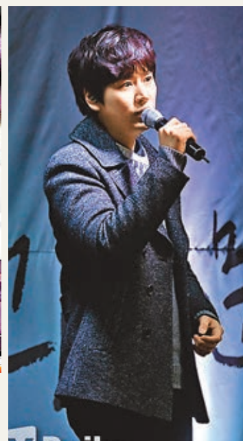
■圭賢舉行音樂會答謝粉絲支持。

另一邊廂，最近推出新獨唱歌的圭賢為答謝粉絲的支持，日前先到光化門演出，隨後又現身梨大校園及江南區舉行兩場音樂會，由於梨大校園的演出場地是露天，而剛巧當時正下着雨，但粉絲仍然冒雨前來支持，令圭賢大為感動。 ■文：Kat