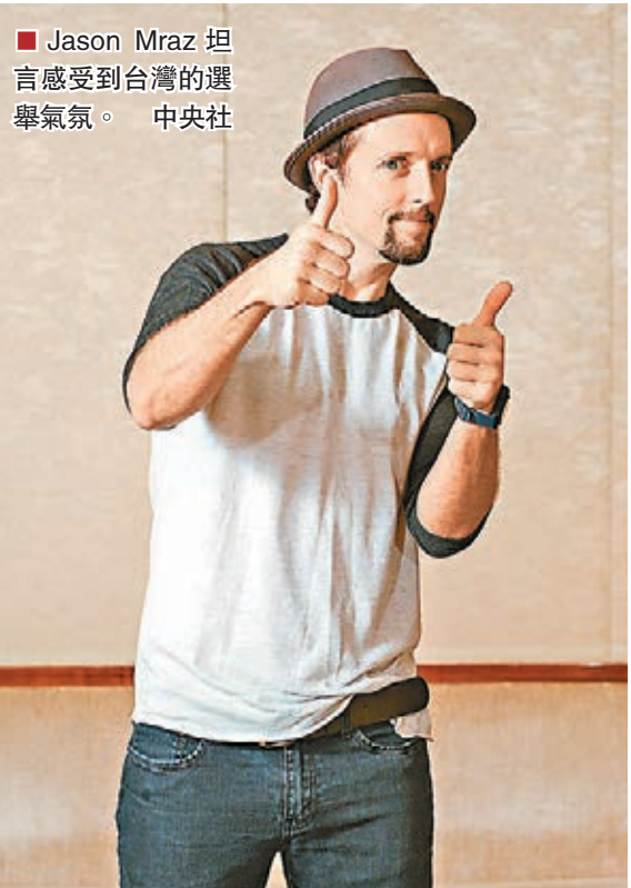
■Jason Mraz 坦言感受到台灣的選舉氣氛。