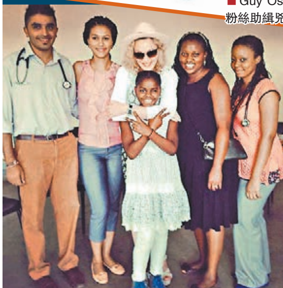
■麥當娜重回馬拉維作親善訪問。