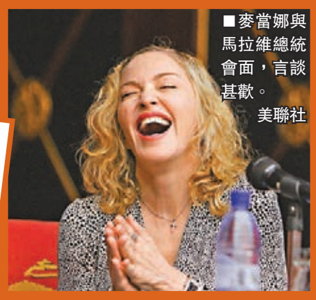
■麥當娜與馬拉維總統會面，言談甚歡。