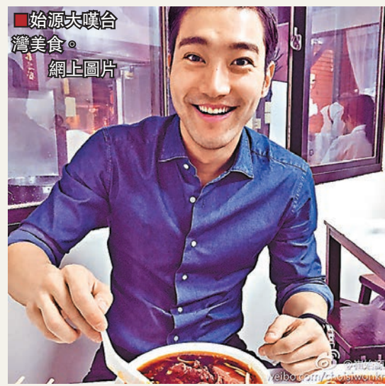
■始源大嘆台灣美食。

另一邊廂，最近推出新獨唱歌的圭賢為答謝粉絲的支持，日前先到光化門演出，隨後又現身梨大校園及江南區舉行兩場音樂會，由於梨大校園的演出場地是露天，而剛巧當時正下着雨，但粉絲仍然冒雨前來支持，令圭賢大為感動。 ■文：Kat