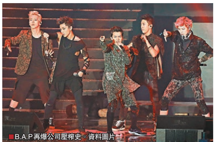
■B.A.P再爆公司壓榨史。