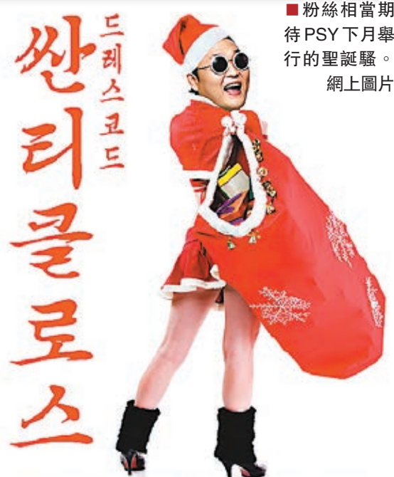
■粉絲相當期待 PSY 下月舉行的聖誕騷。網上圖片

올림픽체육경기장 2014. 12. 19(금) - 24(수) 예매: 인터파크 [TICKET.INTERPARK.COM] 주최·주관: 서울기획 협찬: HYUNDAI