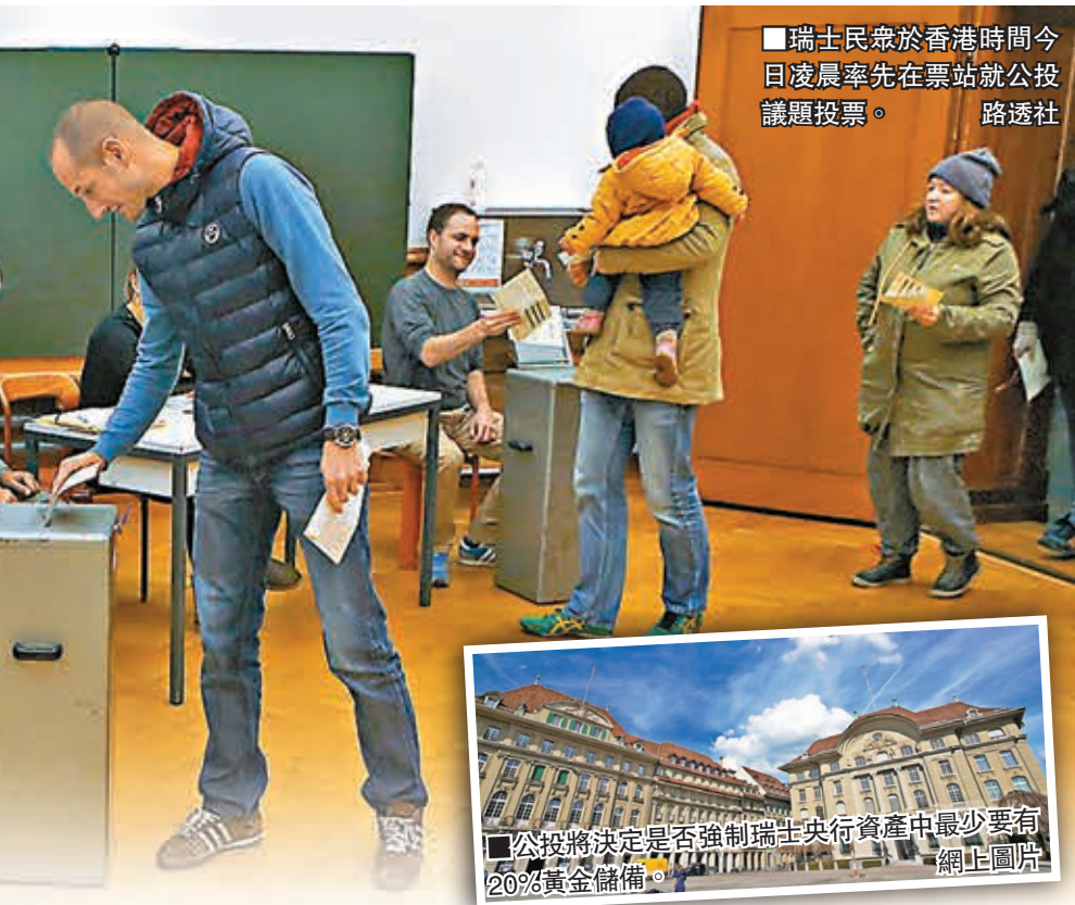
瑞士民眾於香港時間今日凌晨率先在票站就公投議題投票。

瑞士今日舉行所謂「黃金公投」，決定是否強制要求瑞士央行資產中至少要有20%黃金，一旦通過，瑞士央行估計將需增持多達1,500噸黃金，預料會對全球黃金市場構成衝擊。德國商業銀行分析師弗里奇預計，公投若獲通過，金價或會即時跳升50美元或5%，其他分析也預期金價可在後幾星期累升20%。由於瑞士央行此後將需持續定期大規模買金，金價未來幾年都能維持升勢。 公投內容主要包括：禁止瑞士央行出售黃金、調回存放在海外的黃金、資產負債表中必須有20%是黃金。目前瑞士央行黃金儲備只佔總資產的約7%，若要達到這一目標，央行需在未來5年內增持1,500噸黃金，市值約600億美元(約4,653億港元)。 雖然最新民調顯示支持公投的選民比例落後於反對一方，但分析指無論哪方勝出，今次公投都肯定損害瑞士營商吸引力。 作為全球最後一個退出金本位的國家，瑞士央行的黃金儲備比例在1999年仍高達40%，但自從脫離金本位後，央行便持續大量減持黃金，儲備比例直線下降。發起公投的極右瑞士人民黨主張，增加黃金儲備可恢復民眾對央行及瑞郎的信心。 變相回歸金本位 央行靈活性減 瑞士朝野黨派及央行一致反對公投內容，認為一旦獲通過，央行將失去貨幣政策靈活性，未來要維持瑞郎與歐元的聯繫匯率也將更困難。反對一方指出，黃金價