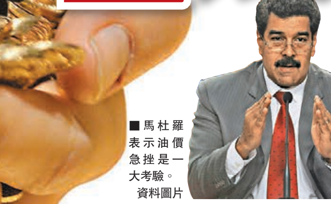
馬杜羅表示油價急挫是一大考驗。