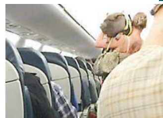
寵物豬重80磅，絕對不小。

物豬對乘客造成滋擾，因此下逐客令。美國運輸部曾就攜帶動物登機訂下指引，准許乘客攜帶「提供精神支持」的動物上機，包括小豬、猴子以至小馬，亦包括協助殘障人士的服務動物(Service animals)。航空公司參考指引後，再決定是否准許寵物上機。