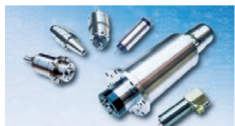
洛陽自主研發的電主軸及主軸單元。

京奧運會等一大批國家重點工程中都有「洛陽製造」和「洛陽技術」。近年來，洛陽圍繞工業結構調整和技術創新，成功實現從「製造」向「創造」驚人一躍，一批創新型企業構建起高新技術產業群。