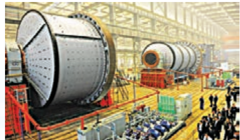
中信重工研製的11m×5.4m半自磨機、7.9m×13.6m溢流型球磨機。

河南洛陽玻璃集團公司自主開發的0.7-1.3毫米超薄玻璃，結束了我國超薄玻璃長期依賴進口的局面；洛陽銅加工集團公司研製的用於集成電路的新型引線框架材料，填補國內空白，其產量佔到國內總量的80%；中信重工集團誕生了亞洲地區直徑最大的齒輪等等，這些企業是洛陽從「製造基地」向「創造基地」跨越的縮影。