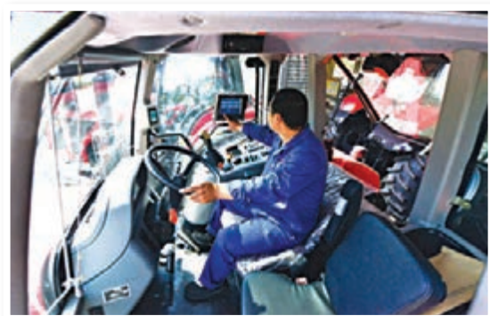
洛陽生產的應用大量智能化、自動化技術的東方紅動力換擋拖拉機。

河南省委常委、洛陽市委書記陳雪楓強調，要成為中原經濟區重要增長極，必須大力發展現代工業，才能達到產業為基、產城互動。洛陽是新中國重點建設的老工業基地，有這個優勢。目前，洛陽已形成裝備製造、有色金屬、石油化工等傳統支柱產業，戰略性新興產業迅速發展的局面，是我國重要的科技研發基地，現有各類科研機構600餘家，各類專業技術人員16萬名，科技人才密度高於全國、河南省平均水平；境內資源豐富，文化、山水、生態等資源優勢處於全國同類城市領先地位。