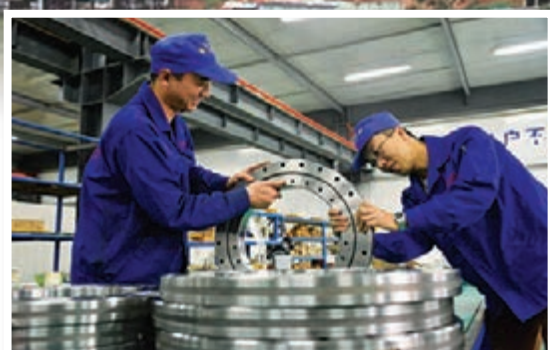
洛陽製造的工業搬運機器人軸承。