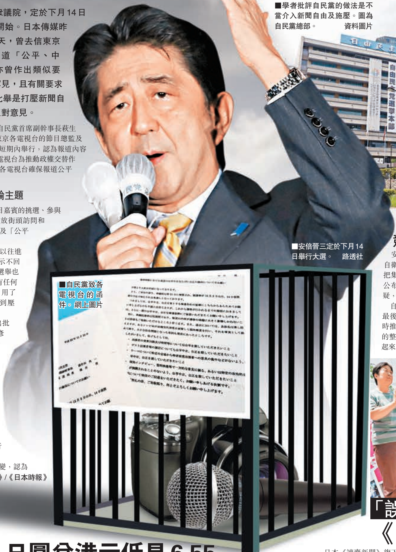
■安倍晉三定於下月14日舉行大選。