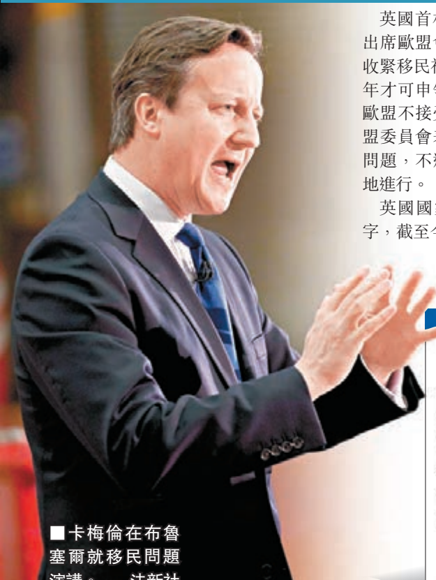
■卡梅倫在布魯塞爾就移民問題演講。

英國首相卡梅倫昨日在比利時布魯塞爾出席歐盟會議就移民問題演講，宣布計劃收緊移民福利，限制歐盟移民在英國住滿4年才可申領不同社會福利津貼，更暗示若歐盟不接受計劃，不排除會退出歐盟。歐盟委員會表示，準備好與卡梅倫討論移民問題，不過任何辯論必須「冷靜而謹慎」地進行。