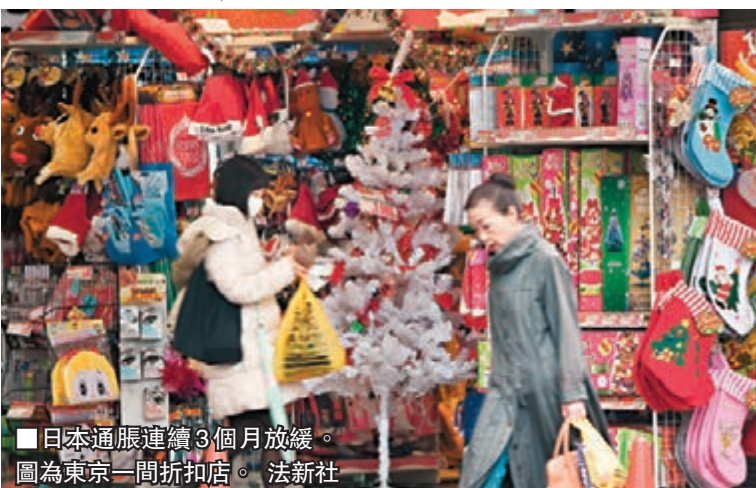
■日本通脹連續3個月放緩。圖為東京一間折扣店。