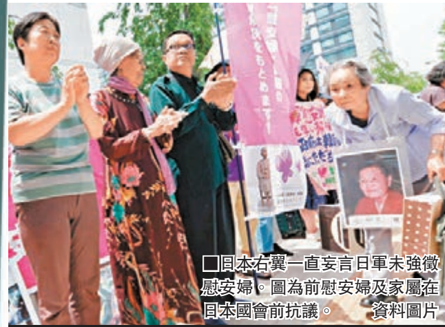
■日本右翼一直妄言日軍未強徵慰安婦。圖為前慰安婦及家屬在日本國會前抗議。 資料圖片