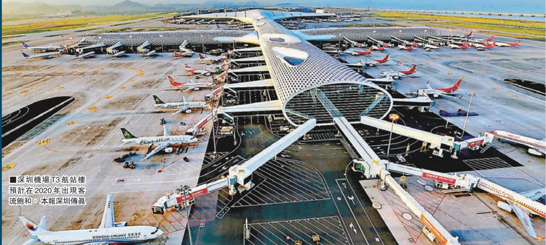
深圳機場T3 航站樓預計在2020年出現客流飽和。

有一位城市規劃專業的博士生對李克強說，她計劃明年畢業後去西部工作，對此總理連聲稱讚。李克強表示，中西部地區城鎮化程度與東部地區有不小差距，但差距也意味著潛力，要靠你們規劃設計，到西部施展專業才華。