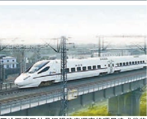
哈爾濱至牡丹江鐵路客運專線項目建成後將大大縮短兩地的車程。

早在10月，為了應對經濟下行壓力，國家發改委當月批覆基建投資近7,000億元；11月25日發改委再批四項鐵路投資，合計新增投資額660億元；加上昨日新批的總投資510億的四個基建項目，兩月新批出的基礎設施投資項目總額已超過8,000億元。