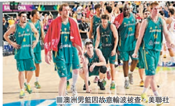
澳洲男籃因故意輸球被禁。美聯社

示，對澳洲隊於9月在西班牙舉行的男籃世界盃小組賽中83:91負於安哥拉隊表示「十分懷疑」。澳洲隊的輸球導致他們最終位居小組第三，這樣他們最早要到準決賽才會碰上美國。