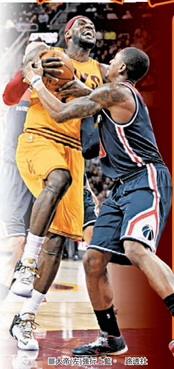
大帝(左)強行上籃。

「我們在用正確的方式打球，分球、防守，盡可能地整場比賽給對方製造壓力。我對球隊在過去兩場中的表現感到滿意，」大帝賽後說。在騎士領先多達19分的情況下，大帝在比賽還剩7分52秒時下場休息，準備開始享受自己的感恩節「禮物」。對於迎來感恩節，大帝亦透露，他準備打破自己嚴格制