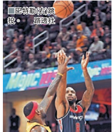
巴特勒(右)跳投。