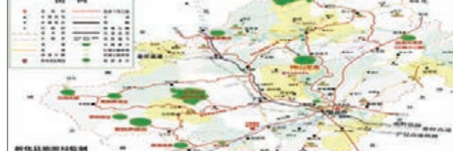
■新化旅遊交通示意圖。