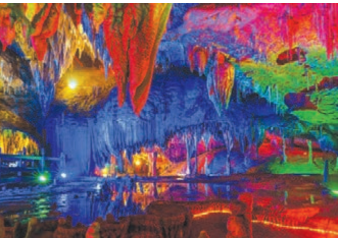
■梅山龍宮水榭歌台。

梅山龍宮適合全年遊覽，無冬歷夏洞內都可以保持恆溫、恆濕。洞府現已探明長度2876米，已開發的面積58600平方米，目前可遊覽的路線長為1896米，其中包括長466米世界罕見的神秘地下河。有九龍迎接賓、碧水連宮、玉皇天宮、龍宮仙苑、龍宮風情、龍鳳呈祥六大景區。其峽谷雲天、哪吒出世、天宮霧松、水中金山、遠古河床被譽為五大世界溶洞景觀之絕。