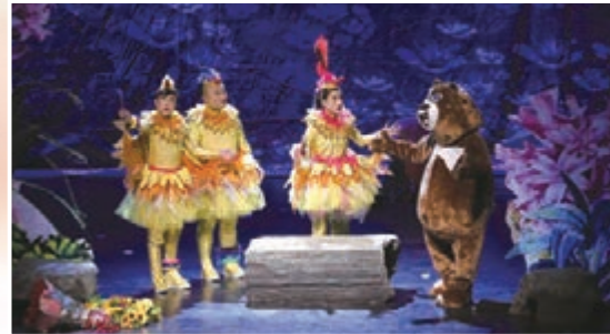
《小麻雀找鳳凰》劇照。