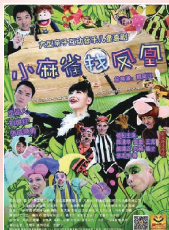
大型親子互動兒童音樂喜劇《小麻雀找鳳凰》海報。

香港文匯報訊(記者 朱利、魏靜磊 鄭州報道)日前，由河南省小麻雀動漫影視文化傳播有限公司挖掘、京城小劇場話劇領軍品牌「雷子樂笑工廠」創作並演出的親子互動兒童音樂喜劇《小麻雀找鳳凰》之《小麻雀的鳳凰夢》成功在北京、遼寧及河南等省市隆重上演，場場爆滿，好評如潮。不日，由北京電影學院、河南電影電視集團等單位與美國冰翼數碼技術公司合作開拍的3D 動漫電影《小麻雀找鳳凰》也將上映，這將是河南首部3D 動漫電影。