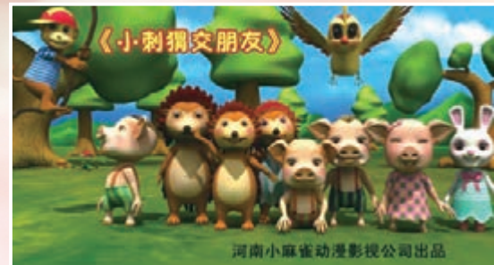
河南小麻雀動漫影視公司出品的《小刺蝟交朋友》劇照。

據了解，《小麻雀找鳳凰》系我國當代童話作家余師夷歷時40年創作的民族經典童話集系列作品，生動形象地反映了民族精神的博大內涵，寄託了偉大民族復興的光榮夢想。