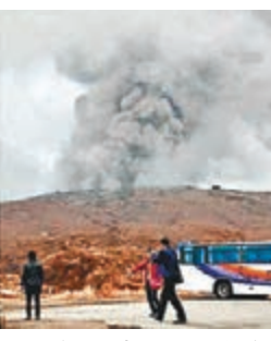
阿蘇山噴煙,並估計地下岩漿可能在向上升。