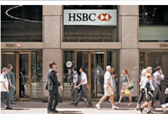
美國司法部傳查問多名匯控交易員。 資料圖片

另外，匯控前日就旗下瑞士私人銀行未經註冊，向美國投資者提供經紀服務，與美國證券交易委員會和解，承認違反聯邦證券條例，同意支付1,250萬美元(約9,694萬港元)罰款。證交會指該