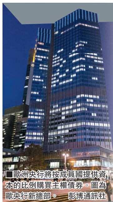
歐洲央行將按成員國提供資本的比例購買主權債券。圖為歐洲央行新總部。