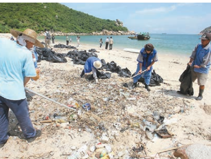
年前南丫島深灣沙灘遺下聚丙烯膠粒，義工到場執拾。