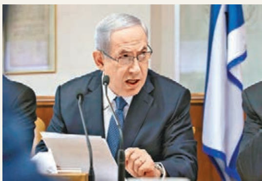
法案由以總理內塔尼亞胡推動，把以色列的定義由「猶太及民主國家」改為「猶太人的國土」。

內閣又通過另一法案，針對曾參與騷亂的阿拉伯人，包括曾於示威中擲石的人，授權政府褫奪其福利及居留權。 ■《泰晤士報》/美聯社/路透社/法新社