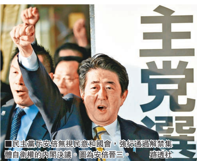
民主黨斥安倍無視民意和國會，強行通過解禁集體自衛權的內閣決議。圖為安倍晉三。