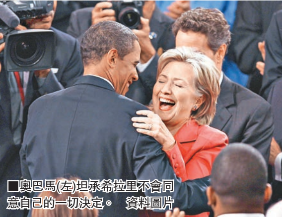
奧巴馬(左)坦承希拉里不會同意自己的一切決定。

奧巴馬指民主黨有數名具實力的總統候選人，但他只點名希拉里。他形容希拉里是傑出的候選人，承認對方不會同意自己的一切決定，競選總統便「可以堅持自己的立場」。希拉里的發言人拒絕就此置評。