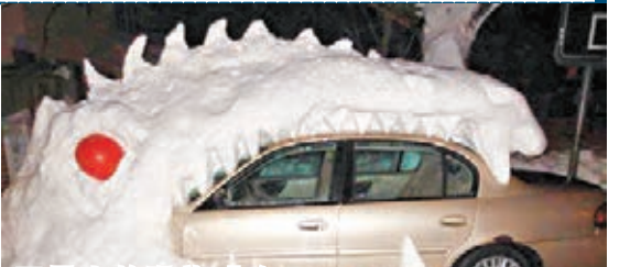
雪砌的恐龍「吃掉」汽車。

這張「怪獸吞車」照片由網友Olsetres上傳到Reddit網站，照片裡可見嘴裡長滿利齒的怪獸，製造怪獸的人選用紅色的球象徵眼睛，Olsetres笑言水牛城居民在雪災下，還保持他們的幽默感。