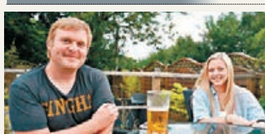
加德納夫婦鍾情印度菜。

英國的加德納夫婦近期遷居法國布列塔尼後，一直難以忘懷英國的印度菜和咖喱，於是說服他們的母親到印度餐廳Tarana Restaurant買外賣，寄往法國給他們享用，寄送過程花6小時，距離達500哩。