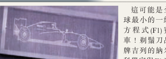
剃刀片上的賽車太細小，肉眼看不到。網上圖片

這可能是全球最小的一級方程式(F1)賽車！剃刀片品牌吉列的納米科學家與F1麥拿拿車隊合作，以光刻技術在剃刀片上，雕出一架250×700微米(即0.25×0.7毫米)的F1賽車，較直徑為1毫米的沙粒更小，單用肉眼看不出來。吉列及麥拿拿正為雕刻申請列入健力士世界紀錄。