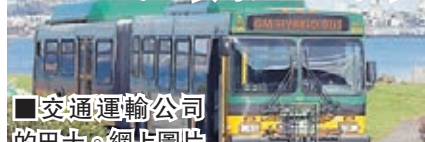
交通運輸公司的巴士。

美國華盛頓州金縣交通運輸公司的巴士司機，為準時抵達目的地強忍小便，結果部分司機在座位上解決，一些司機就自備成人尿片或水樽解決。