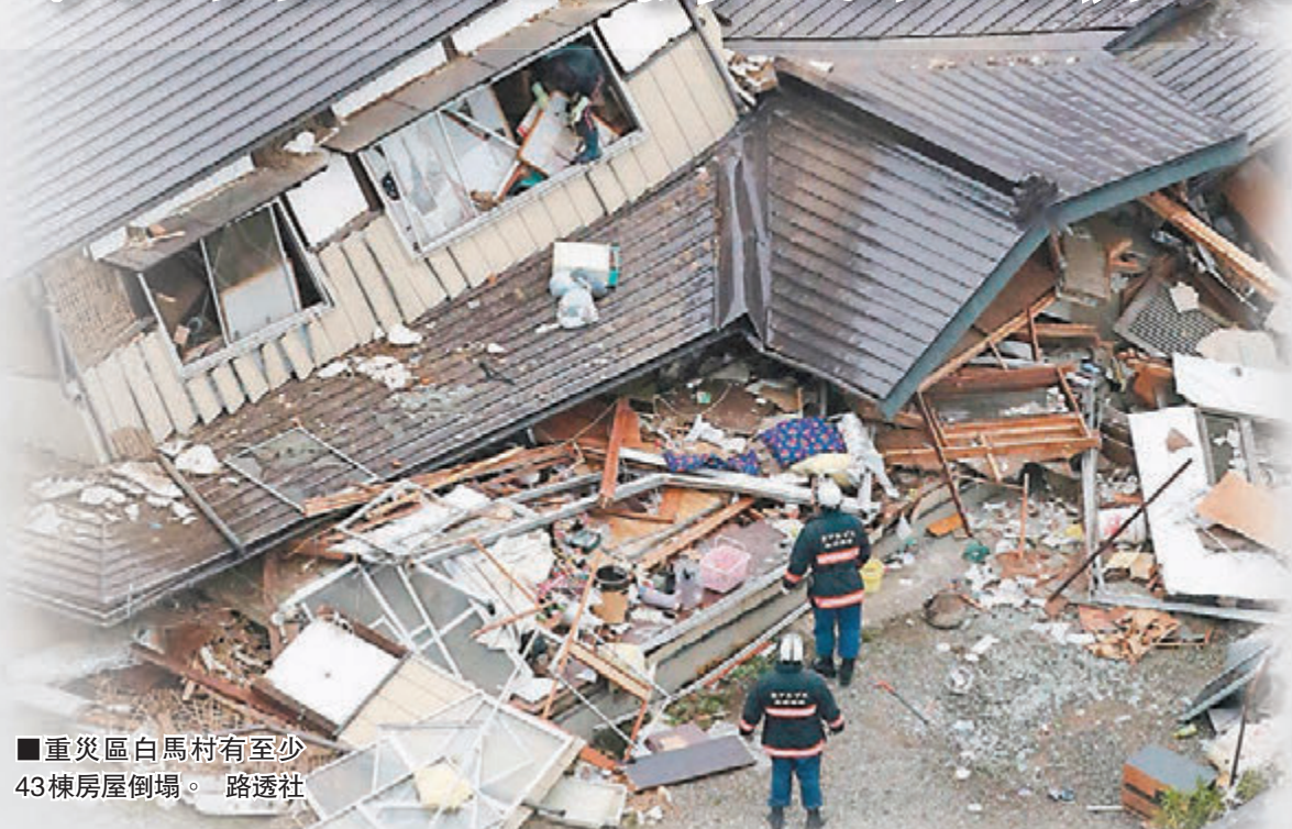
重災區白馬村有至少43棟房屋倒塌。

日本中部長野縣前晚發生黎克特制6.7級地震，至少41人受傷，其中7人重傷，約50棟房屋倒塌，位於縣北的滑雪勝地，曾是1998年冬季奧運賽場的白馬村是重災區。截至昨晚，震區發生70次餘震，最高達4.3級，氣象廳警告，由於有關地區地殼活躍，未來一周極可能發生強度較大的餘震，自衛隊已派出小隊前往災區，長野縣政府亦決定對白馬村等重災區實施《災害救助法》。