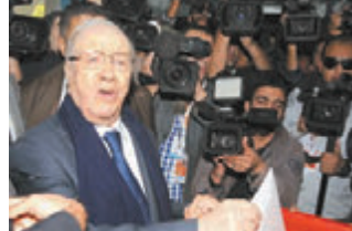
埃塞卜西支持率最高，圖為他到票站投票。新華社

「茉莉花革命」推翻突尼斯前總統本·阿里，新憲法大大限制總統權力，改行議會內閣制。支持者認為只有埃塞卜西有能力阻止伊斯蘭武裝勢力坐大，反對者則認為他曾任本·阿里政府當官，擔心前朝復辟。 ■法新社/路透社