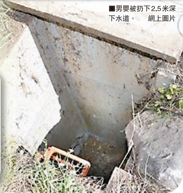
男嬰被扔下2.5米深下水道。