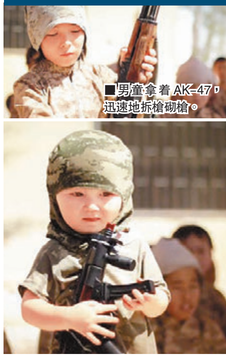
男童拿着AK-47，迅速地拆槍砌槍。