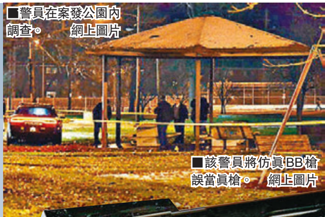
警方在案發公園內調查。網上圖片