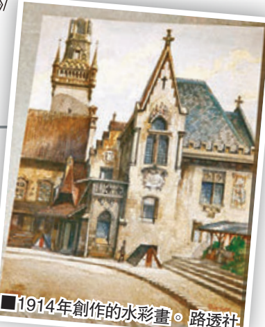
1914年創作的水彩畫。