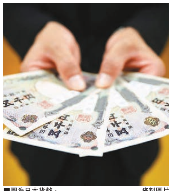
圖為日本貨幣。