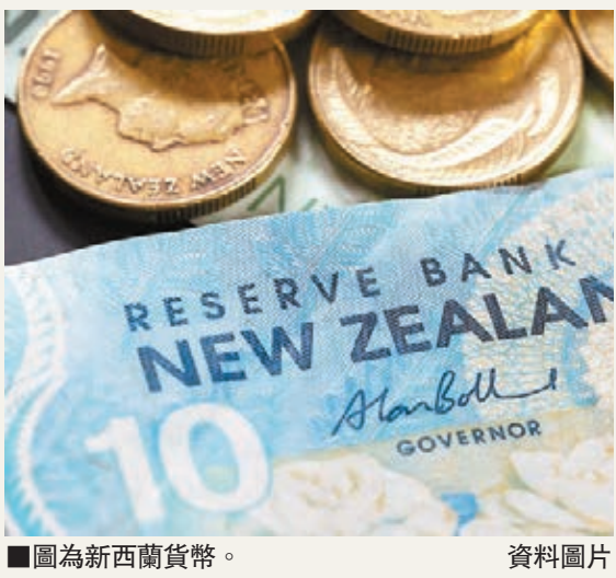
圖為新西蘭貨幣。 資料圖片

紐元：紐元將反覆重上79.50美仙水平。 金價：現貨金價將反覆走高至1,210美元水平。