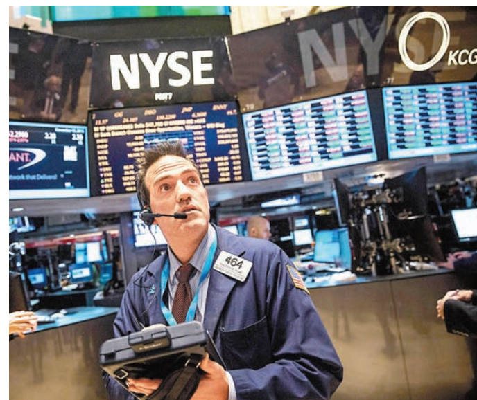
在全全球股市情緒跟隨經濟數據跌宕起伏之際，可換股債券因屬股票與債券的混合體，將可發揮進可攻退可守之功效。圖為紐交所交易大堂。

F&C環球可換股債券基金的資產行業比重為20.16%資訊科技、18.76%金融業、15.19%非必需品消費、14.4%工業、11.72%健康護理、6.35%能源、5.76%原材料、2.08%必需品消費、1.49%公用事業及0.99%電信服務。資產地區分布為58.78%北美洲、17.87%亞太地區、17.08%歐洲、3.1%現金與應收/應付款、1.19%拉丁美洲、0.99%中東與非州及0.99%加勒比