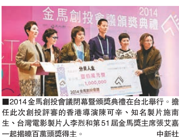
2014金馬創投會議閉幕頒獎典禮在台北舉行。擔任此次創投評審的香港導演陳可辛、知名製片施南生、台灣電影製片人李烈和第51屆金馬獎主席張艾嘉一起揭曉百萬頭獎得主。中新社

JC和安志杰正在熱戀中,她大讚男友是好男仔,走在她身邊有火花,希望找到真愛,感覺是件很神奇的事。她說以前拍拖同男友都是分隔二地,感受到很大壓力,今次兩個人都在同一個地方,大家都好開心,我們是好朋友,現在約會都是食飯、看電影。對於她拍拖短數天已被拍到上男家過夜,她羞答答說大家是一起看電影,但過程很浪漫。又,松岡趁日幣貶值,便在自己的出生地廣島置業,首期只需二十多萬港元,她打算放租作長線投資,為未來打算。