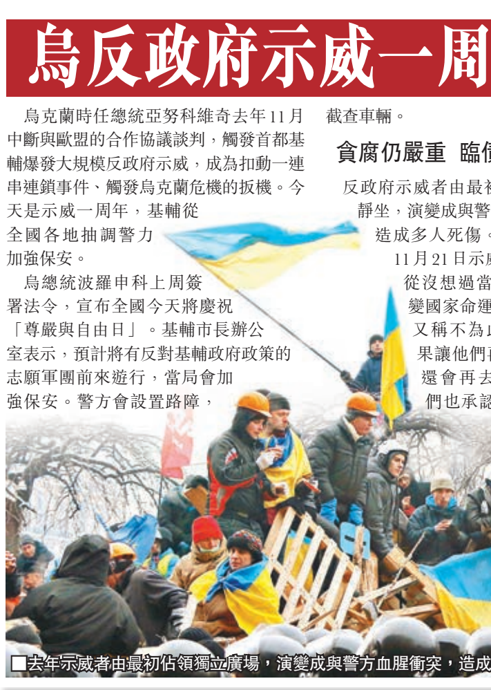
去年示威者由最初佔領獨立廣場，演變成與警方血腥衝突，造成多人死傷。資料圖片

準備好放棄 非法移民在白宮外促請奧巴馬改革移民政策。美聯社 美國皮尤研究中心數字顯示，去年3月美國境內約有1,130萬名非法移民，佔勞動人口5.1%。最高峰時期是2007年，人數達1,220萬，佔當時全國總人口4%。據估計，全美約7%中小學生的父母，最少1人為非法移民，這些學生有79%是在美國出生。 墨西哥人佔最多 鄰國墨西哥是美國非法移民的主要來源，2012年有590萬人，佔總數超過一半。加州、得州、佛羅里達州、紐約州、新澤西州和伊利諾伊州的非