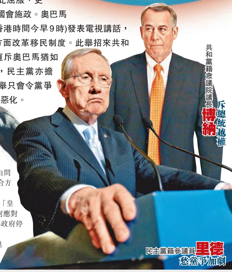
共和黨眾議院議長博納 斥總統越權 民主黨參議員里德 恐黨爭加劇

伊朗最後一輪核談判 死線前難達協議 伊朗核問題達成全面協議的期限下周一屆滿，目前各國正在奧地利維也納進行最後一輪談判，但雙方均未讓步跡象，英美均不表樂觀，令伊朗核危機重燃的風險加劇。美國國務卿克里強調，達成協議的責任在伊朗，伊朗必須讓步，向全世界證明有意推進和平。伊朗總統魯哈尼則指出，若美國等參與談判的6個國家不提出「過分要求」，仍可能達成協議。 去年11月，伊朗與美國、英國、法國、中國、俄羅斯及德國在日內瓦達成臨時協議，伊朗由今年1月20日至7月20日暫停部分敏感的核計劃，包括銷毀濃度20%、足以製造核武的濃縮鈾，以及暫停興建位於阿拉克的重水反應堆，換取西方撤銷部分經濟制裁，6國及伊朗間繼續尋找解決核問題方案，不過雙方就其他關鍵議題，如限制伊朗濃縮鈾計劃、解除對伊制裁時間等存有分歧，令談判限期延至本月24日。 克里：無意延期 美國副國務卿布林肯表示，協議很難達成，但並非沒可能，「視乎伊朗是否願意採取必須步伐，說服美國及其他5國相信伊朗核計劃純屬和平目的。」英國外相文達不感樂觀，但表示若有足夠進展，或可再次延期，令談判不致破裂。不過，克里昨在巴黎啟程往維也納前表示，與會國家未有討論延長限期。 美國武器管制協會分析師達文波特表示，雙方其實有意達成協議，目前仍有足夠時間，關鍵是雙方是否願意讓步，令談判更具彈性。歐洲對外關係委員會則認為，若全面協議無法達成，或會達成諒解備忘錄，為具體細節敲定時間。 ■路透社/法新社/美聯社/《衛報》