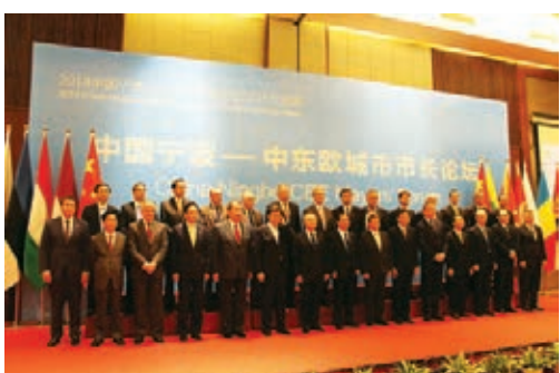
寧波—中東歐城市市長論壇舉行推進寧波國際化進程。

行動綱要》總方案、寧波港集團編制的《港口聯盟建設實施方案》、市外經貿局編制的《擴大經貿合作實施方案》、市外辦編制的《擴大人文交流實施方案》和梅山保稅港區編制的《網上絲綢之路試點工作實施方案》等4個子方案。