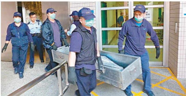
警員到聯和道女嬰猝死現場調查。