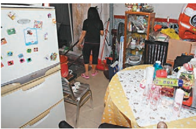
粉嶺聯和道發生女嬰猝死分租單位,是三戶人共用客廳。