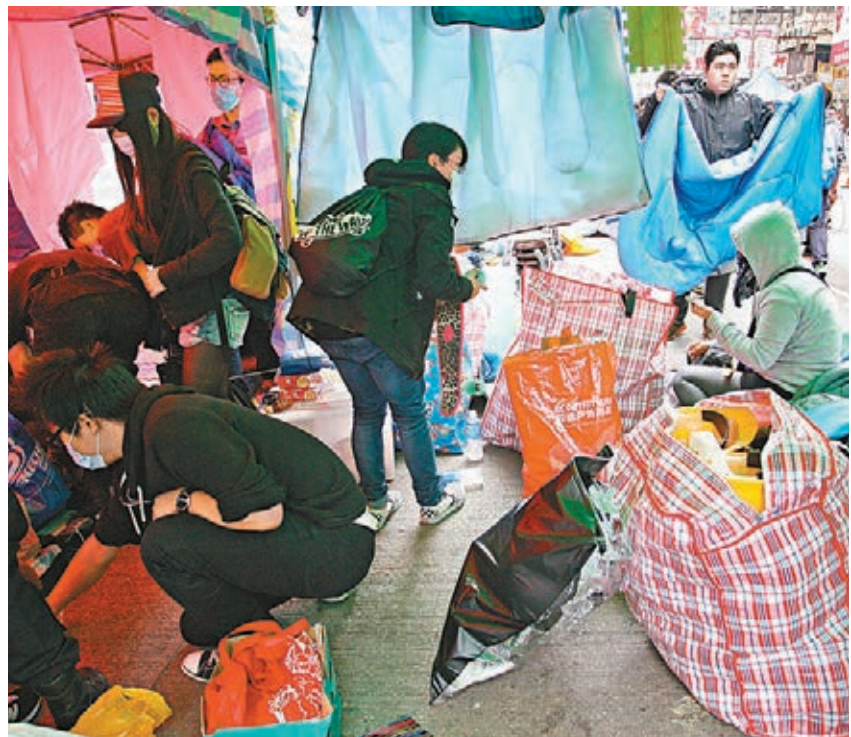
■調查指近83%受訪市民要求停止「佔領」。在昨日旺角「佔領區」,部分人已經收拾細軟,準備離開。

香港文匯報訊(記者 鄭治祖)香港市民對違法「佔領」行動忍無可忍。根據香港大學民意研究計劃昨日公布有關「佔領」行動的最新民意調查顯示,近83%受訪市民要求停止「佔領」,支持繼續「佔領」的僅得13%,有68%受訪者更贊成立即「清場」。調查又明顯發現受訪者認為特區政府比「佔領」學生更有誠意解決目前困局,倘以0分代表「極無誠意」,10分代表「極有誠意」,逾24%受訪者認為學生的誠意為0分。