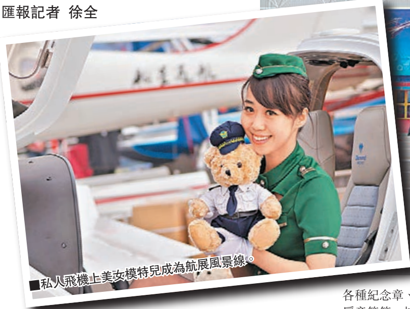
私人飛機上美女模特兒成為航展風景線。

與香港書展的觀模引發輿論爭議不同，航展中的不少參觀者則對航空模特多持正面態度。他們認為，私人飛機模特確實對參觀者產生了非常大的吸引力，是成功的行銷手段。而且，模特們本身的目光語言、肢體語言，對參觀者而言，都具有強烈的親和感，使得參觀者有賓至如歸的感受。參觀人士也同樣認為，航空模特和汽車模特，