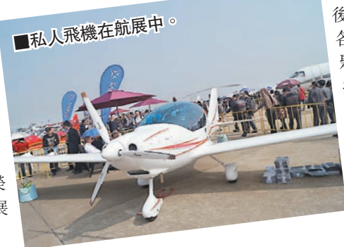
私人飛機在航展中。

如今，航展已經落幕。兩年之後，無論是參展國，還是來自世界各地的參觀者，兩年之後，將再聚首於珠海。航展不僅僅是高科技與航空工業成果的展示，也是一次與航空有關的文化匯聚與交流，更象徵着對和平主義和友愛互助的永恒追求。這將是人類文明永遠不變和不斷探索的主題。