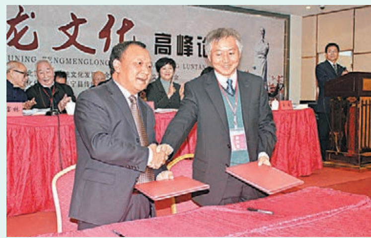
在本屆論壇上，蘇州市相城區與福建省壽寧縣締結友好區縣。

馮夢龍的「官道」正直。中國俗文學學會常務理事傅承洲指出，馮夢龍由江南水鄉蘇州，千里迢迢來到壽寧。選擇在61歲時，到窮鄉僻壤任職，充分說明了他是個不為升官、不為發財的人。傅承洲說：「馮夢龍是一個文化寶藏，不應單一地挖掘他的文學造詣，