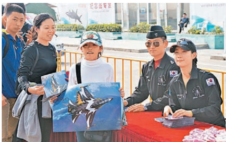
韓國空軍以流行文化行銷方式，派送宣傳海報。