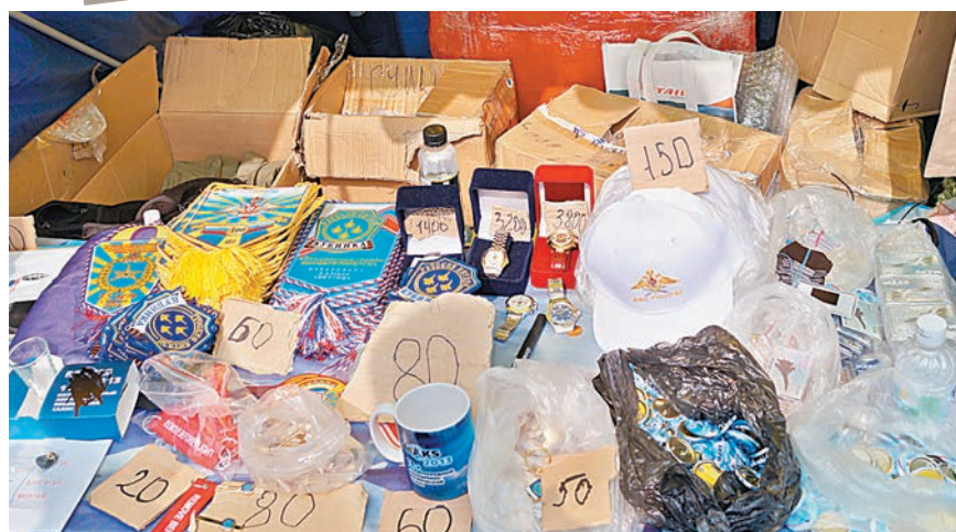
展現俄國軍事文化的勳章、旗幟等紀念物，頗受參觀人士歡迎。