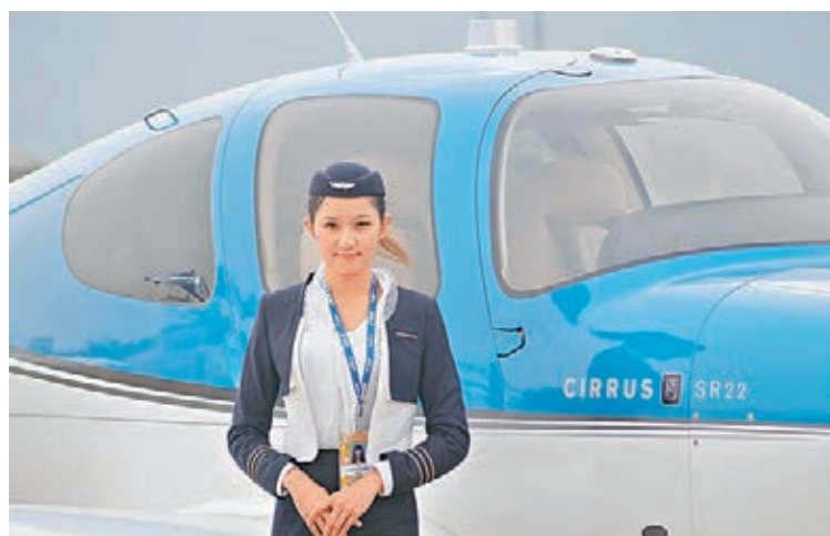
參觀者對航空模特多持正面態度，認為其帶來了親和審美感。