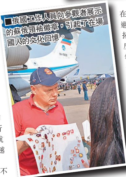
俄國工作人員向參觀者展示蘇俄領袖徽章，引起了在場國人的文化回憶。

在工作上其實帶有很大的相同性，只不過，航空模特將這種美感從陸地的奔馳拓展到了天空的翱翔。這從一個側面反映了中國私人飛機與商務航空蓬勃發展的前景。現場的私人飛機模特們，也很配合參觀者和傳媒人員的期待，應大家各自的鏡頭需要，完成拍攝，可謂互動良好。