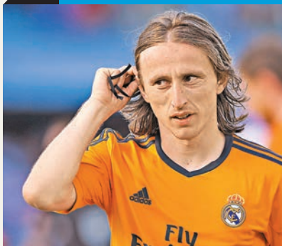
莫迪歷明年見。

日前對意大利時退下火線的克羅地亞球星莫迪歷昨證實左腿肌肉受傷，西甲皇家馬德里未來3個月會缺少這位中場核心，料將挽留盛傳離隊的基迪拉。