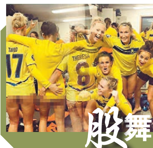
邦比女子足球隊日前比賽贏波，將在丹麥女子聯賽的榜首優勢擴大到5分。一班球員慶祝時玩到癲，還上載了一張齊除波褲現屁股狂歡的更衣室照片。網上圖片