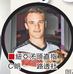
紐亞頭直指C朗。

2014年「金球獎」候選名單公布後，協助德國隊勇奪世界盃冠軍的「門神」紐亞被視為得獎熱門之一，但頂頭大熱始終是屢破紀錄的皇家馬德里葡萄牙「天王」C·朗拿度。紐亞近日坦言，自己在今次「世界足球先生」選舉中不會獲選為最佳，因為自己不及C朗高調識「露底」。