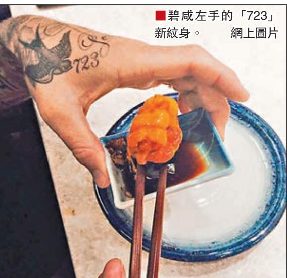
碧咸左手的「723」新紋身。網上圖片