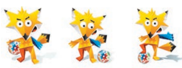
智利美洲盃吉祥物曝光。

南美足協昨公布了2015年智利美洲盃的吉祥物，是生活在智利北部叫赤狐的卡通版公仔，並揀了ZINCHA、ANDI和KUL三個名字，讓球迷投票選出吉祥物最終的名稱。