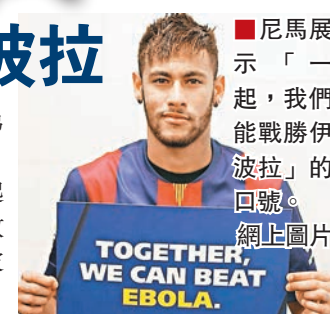
尼馬展示「一起，我們能戰勝伊波拉」的圖說。

在世界銀行17日發起的一項新活動中，包括尼馬、C·朗拿度、杜奧巴和拿姆等在內的世界足球巨星和全球衛生專家一起，利用宣傳片、展示寫上字句或圖案卡紙等手段，和人們分享11項防治伊波拉病毒的簡單信息。在宣傳片中，C朗畫圖告誡人避免和伊波拉病人有身體接觸。提醒人們感染伊波拉病毒後會有何種症狀的巴西球星尼馬說：「讓我們團結一起，幫疫情最嚴重地區的兄弟姊妹，聯合起來打敗伊波拉。」