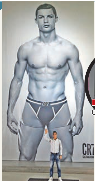
C朗的自家內衣褲品牌。